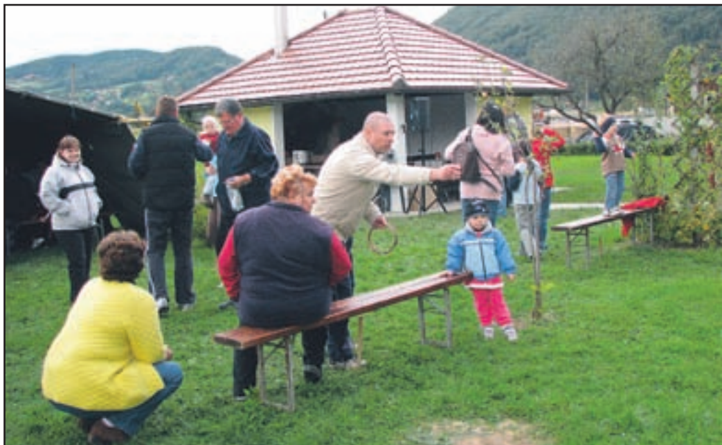
Letošnje rečanje so prvič opestrili zn ekaterimid ružabnimii gram:m etanjemo bročev, zabijanjem žebjev v tnal, streljanjem z zračno puško, metanjem pikada.