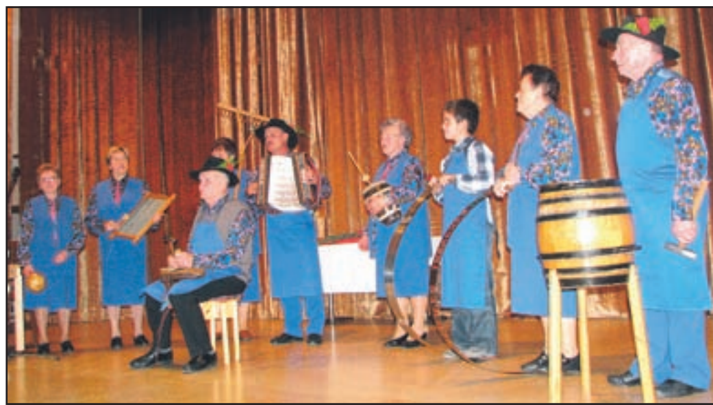
Brez Konovskih štrajharjev, priznanih ljudskih godcev, na Konovem mine redko katera prireditev. Njihov sobotni nastop je bil tudi napoved koncerta, ki ga pripravljajo to soboto.