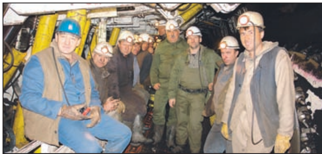
Zadovoljni brazy v jami Mramor.