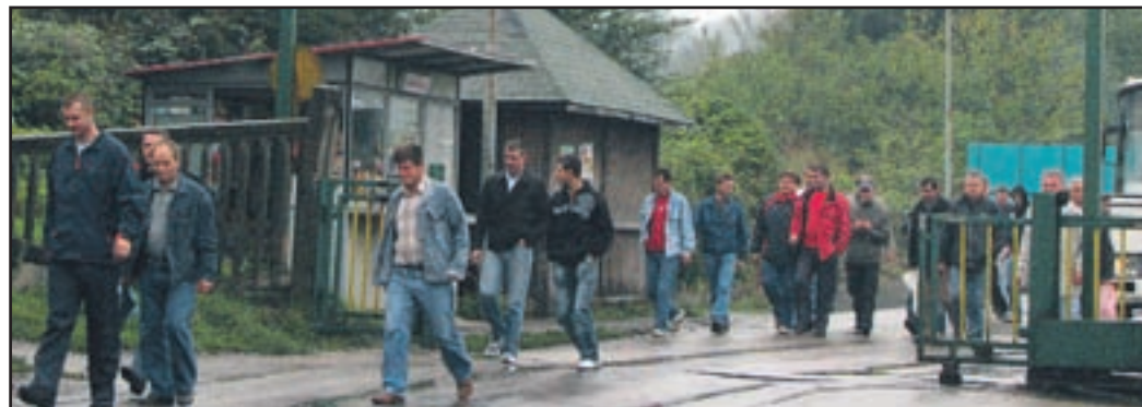
Priloh opoldanskimi zmenami