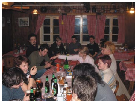
Študenti v koči na Pohorju