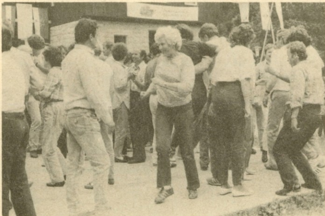
V ritmu ansambla Rž.