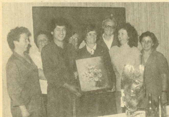
Lube Kristina iz de-20