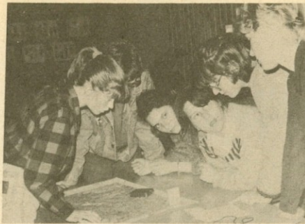
Dekleta na obrambnem dnevu.