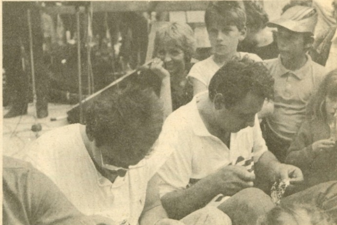
Iz zabavnega programa srečanja: šivali so gumbe.