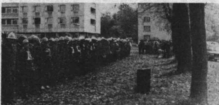
Občinski štab za civilno zaščito je pripravil 8. oktobra pregled za zamudnike (prvi občinski pregled je bil junija) in pregled za gasilske enote civilne zaščite. Oba pregleda sta bila na območju KS Poljane. Splošne in specializirane enote CZ so pokazale visoko stopnjo usposobljenosti.

V okviru nabornih priprav in nabora bo konec meseca tudi slavnostna podelitev vojaških knjižic.