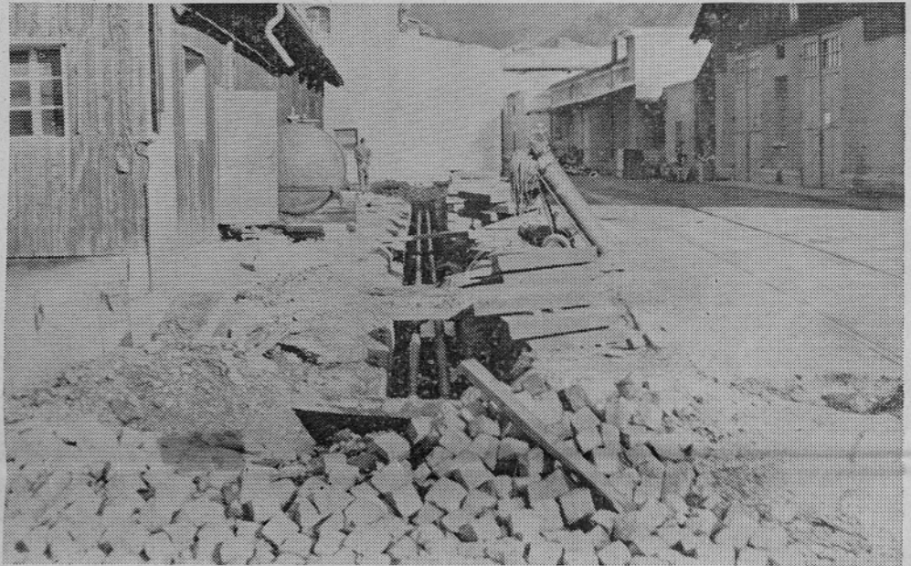
Dela na obnovitvi parovodnega omrežja gredo h kraju

Opravljena so bila razna vzdrževalna dela na strižniku, belilnem agregatu, obeh razpenjalnih sušilnikih, novem kalandru in enem od merilnih strojev, vendar večjih izpadov proizvodnje zaradi tega ni bilo.