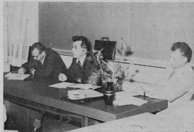
Delovno predsedstvo na sestanku komunistov