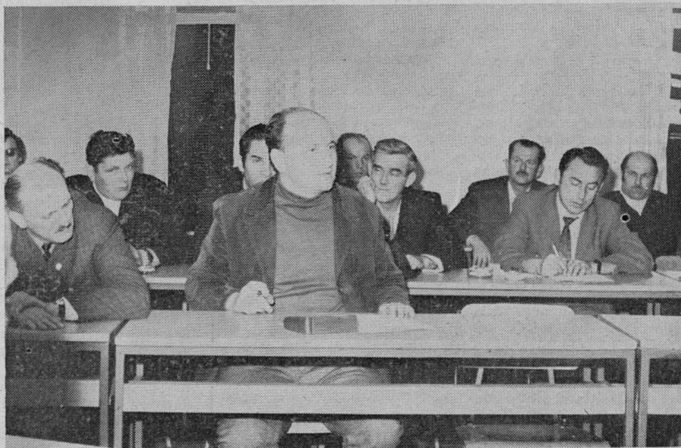
V kritični razpravi so sodelovali tudi člani našega aktiva ZK