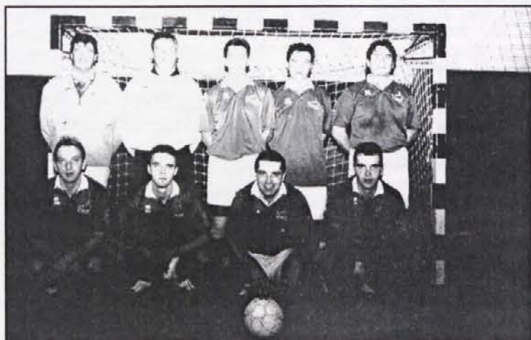
La squadra vincitrice "CI Buie"

È stato un vero incontro dell'amicizia il sesto Torneo internazionale di calcetto organizzato dalla Comunità degli italiani "Pasquale Besenghi degli Ughi di Isola". È stato animato dalle squadre della "Guardia di Finanza" di Trieste e da quelle delle comunità degli italiani di Buie, Castelvevenero e Isola. Si è giocato (sabato, 14 novembre) al palazzetto dello sport della nostra cittadina. La vittoria è andata ai buiesi. Secondi gli isolani. Terzi i triestini. Quarta la simpatica squadra della CI di Castelvevenero che è stata prima nei canti dopo partita. Ottimi l'organizzazione e l'operato dell'arbitro capodistriano Roberto Ponis.