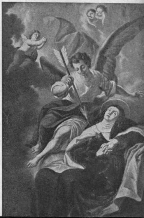
15. oktober. Sv. Terezija. Beneška slika. Uršulinska cerkev, Ljubljana

Podpirajmo torej misijone z molitvijo, z voljnimi prenašanjem časovnih bridkosti in z odpovedjo. Podpirajmo pa jih po svoji moči tudi z denarnimi prispevki. Če je že v mirnih časih v misijonskih krajih mnogo potreb, jih je danes v vojnih prekucijah še toliko več. Če so že v mirnih časih denarni darovi misijonarjem potrebni (za zidanje kapel in cerkva), so danes še dvakrat bolj zaželeni.