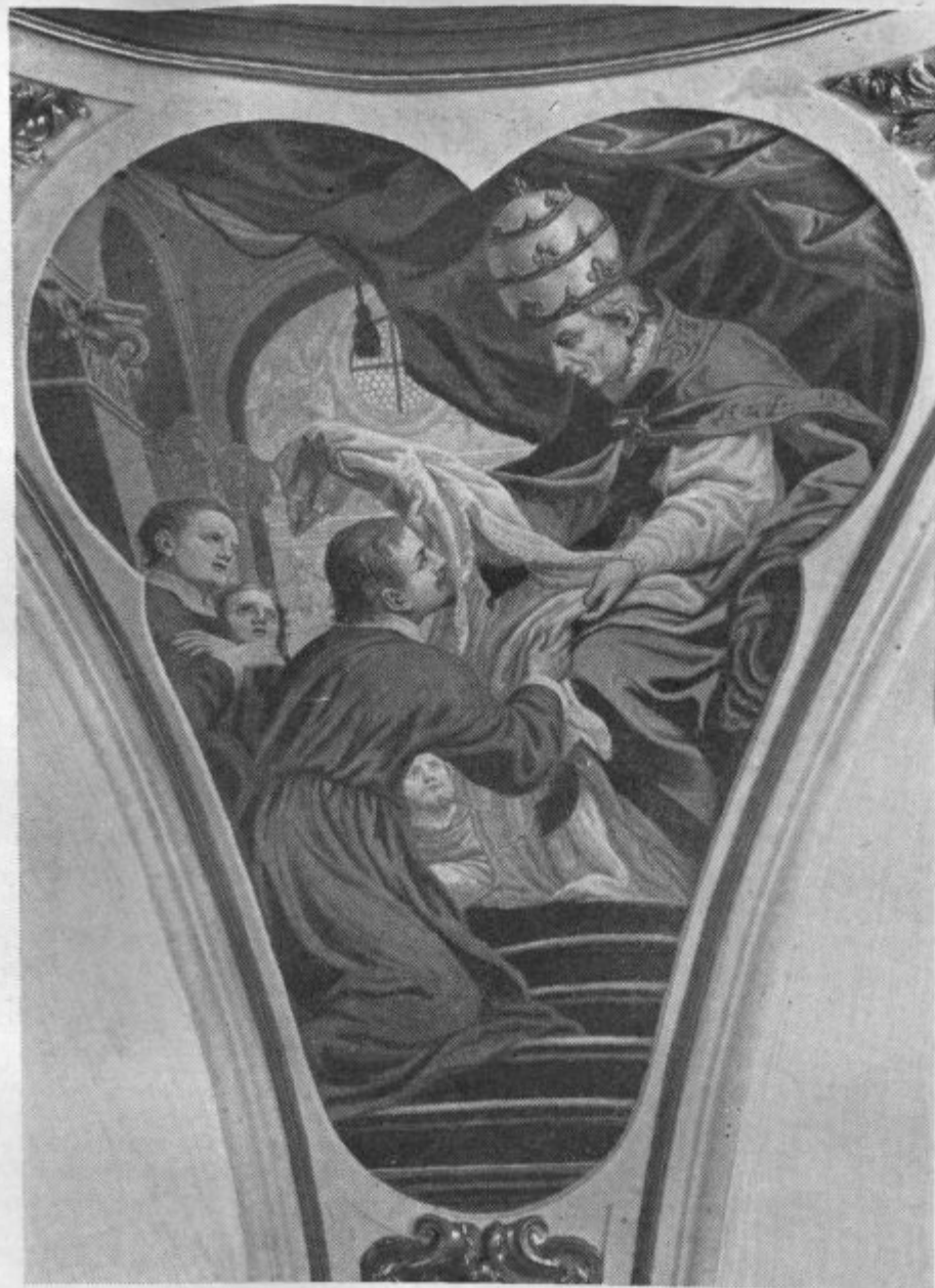
Jul. Quaglio: Papež Pij II. posvečuje prvega ljubljanskega škofa. Ljubljanska stolnica.

Ves naš narod mora poslušati Marijino naročilo: možje in fantje, žene, dekleta in otroci. Vsi stanovi se morajo združiti v tej prelepi molitvi: preprosti in izobraženi. Tako smemo upati, da si bo v pobožni molitvi sv. rožnega venca, ki je v tem, da ne molimo le z ustnicami, ampak premišljevaje, naš narod izprosil versko obnovo in pravičen mir.