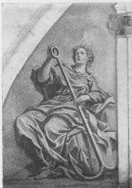
Jul. Quaglio: Upanje. Ljubljanska stolnica.

Kdo bi bil mislil pred par leti, ko je zbral »Prerod« peščico zavednih mož in fantov k prvi mesečni obnovi v Ljubljani, da bo v tako kratkem času narasla armada mož in fantov, katerim bo za mesečno obnovo tudi ljubljanska stolnica premajhna! Saj šteje danes ta armada, ki je po svoji organizaciji v podrobnosti izpeljana, malo manj kot 2000 mož