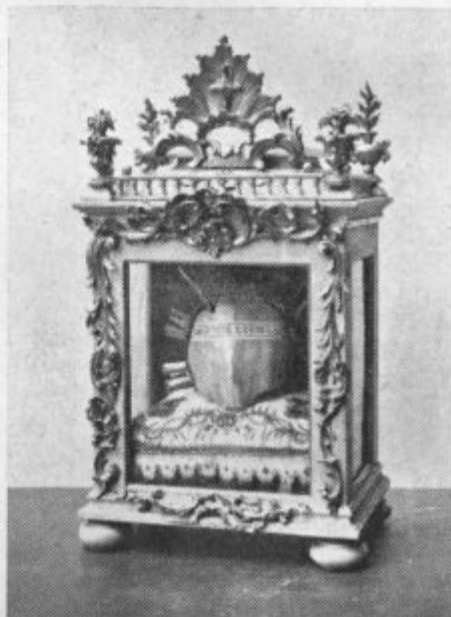
Pri relikviariju: 21. okt.

jeno družinsko žioljenje, odprava sovraštva in sebičnosti ). Če se te na splošno versko mlačne, pa po posvetitvi vsaj zaenkrat za Boga pridobljene družine ne bodo živo zavedale teh dolžnosti, ne bo posvetitev imela nobenega trajnega sadu. — Zato je dolžnost vseh apostolov in zlasti Marijinih sinov in hčera, da posvečajo svojo apostolsko skrb tudi tem družinam. Tudi v tem oziru naj odbori Marijinih družb dobijo kartoteko posvečenih družin , razdeljeno po posameznih ulicah in naj skrbijo po svojem članstvu, da bodo te družine pod nenehnim apostolskim nadzorstvom za izpolnjevanje dolžnosti, ki jih nalaga posvetitev brezmadežnemu Srcu Marijinemu .