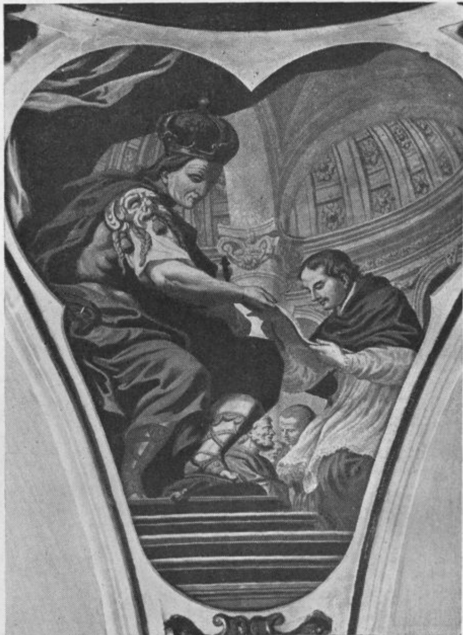
Cesar Friderik III. ustanavlja ljubljansko škofijo. Ljubljanska stolnica.