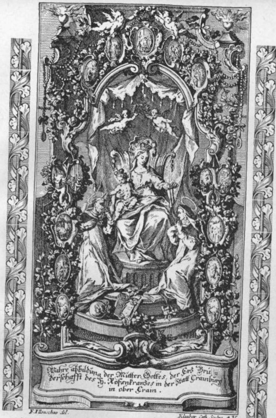
Stara sprejemnica v rožnovensko bratovščino. Risal Jelovšek. Kranj

ške resnice in nočejo odpreti src za navdihe božje milosti, tega ni krivo samo to, ker sami premalo molijo, ampak ker tudi kristjani premalo goreče za to molijo. Zato pa ponovno spodbujamo vse, ki goreče ljubijo Cerkve, naj po Odrešenikovem zgledu stanovitno molijo v ta namen.