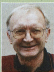
Piše: Doro Hvalica