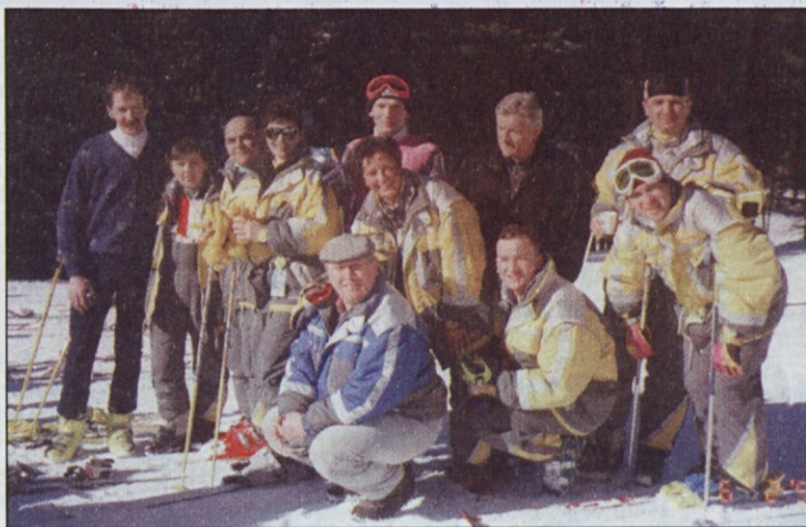
Na 7. zimskem srečanju delavcev slovenskih hidroelektrarn se je najboljša odrezala ekipa Savskih elektrarn