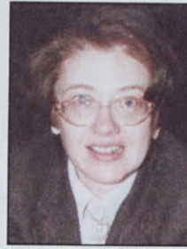
Piše: Lučka Böhm

Vlada je v predlogu bele knjige ugodila pritožbam delodajalcev o neživljenjskosti določil veljavnega Zakona o pokojninskem in invalidskem zavarovanju, zaradi katerih so (razen če zaposlujejo manj kot pet delavcev) dolžni delovne invalide obdržati na delu in jih razporediti na drugo ustrezno delo. Pri tem ni pomembno, ali je invalidnost posledica vzrokov iz dela ali pa z delom nima nobene zveze. Kljub temu, da veljavno invalidsko zavarovanje delodajalce razbremeni, tako da delovnim invalidom izplačuje denarna nadomestila plače zaradi izgube zaslužka zaradi praznoreditve na slabše plačano delo, delodajalci trdijo, da za delovne invalide težko najdejo ekonomsko upravičeno delo, ki ustreza njihovim zdravstvenim omejitvam. Predlog bele knjige delodajalcem daje možnost, da bodo lahko po reformi odpustili večino svojih delovnih invalidov.