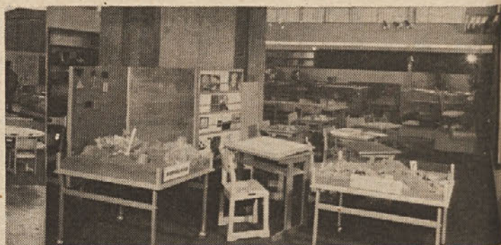
Na III. mednarodni razstavi učil in šolske opreme bo dan poudarek funkcionalnemu opremljanju v celodnevni šoli

Na III. mednarodni razstavi učil in šolske opreme, ki bo od 16 do 22. aprila 1975 na Gospodarskem razstavišču v halah A in C, bo sodelovalo okrog 100 podjetij iz 10 držav. Pokrovitelj razstave je predsednik CK ZKS tovariš France Popit.