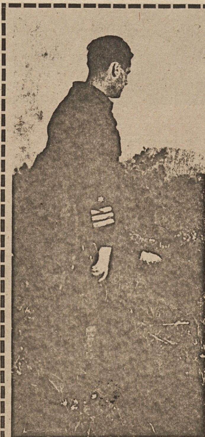
Načelnik glavnega štaba 29. junija 1944 po napadu IX. korpusa v Baški grapi