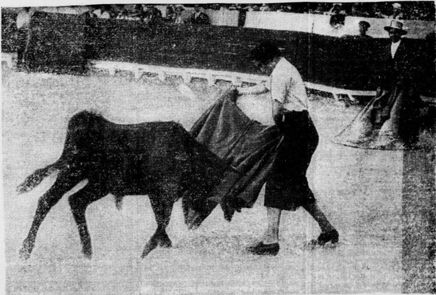
kajti Francova vlada je ženskam prepovedala, da bi se bavile z bikoborbo