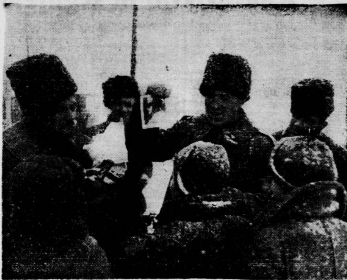
za italijanske vojake na ruski fronti