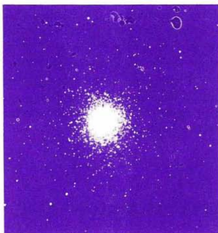
Slika 2. Kroglasta zvezdna kopica M 15, posneta z zelo zmogljivim daljnogledom.

Ozvezdje Pegaz je sestavljeno iz štirih svetlih zvezd, ki oblikujejo na nebu velik "kvadrat" ( Miza ), od katerega štrlita dva različno