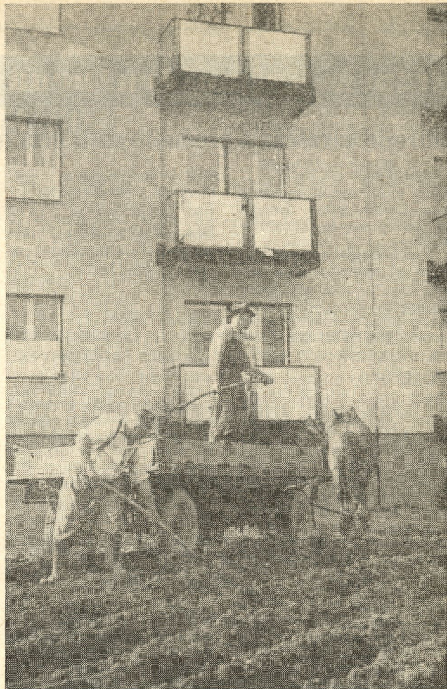
Zanimivi kontrasti današnje Šiške