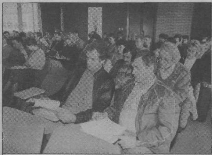
Predsedniki osnovnih organizacij sindikata ozdov naše občine, ki so se zbrali na zadnjem posvetu v tem mandatnem obdobju, morajo do konca leta opraviti še kar nekaj pomembnih nalog.

Seminar za predsednike svetov in tajnike krajevnih skupnosti, ki ga je organiziral občinski sekretariat za ljudsko obrambo, je bil 28. oktobra na Razorih. Na seminarju so udeleženci dograjevali obrambne in varnostne načrte krajevnih skupnosti v naši občini. P. K.