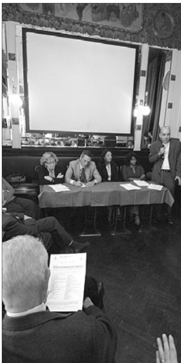
Na listi Za Zvecha veliko mladih

Na seznamu večina ljudi med 19. in 35. letom starosti - Med njimi šest Slovencev