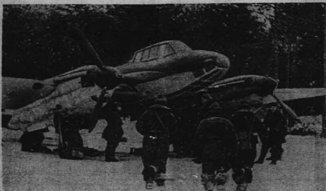
Slika nam kaže ruski bombnik, ki je posebno izdelan za zimske operacije.