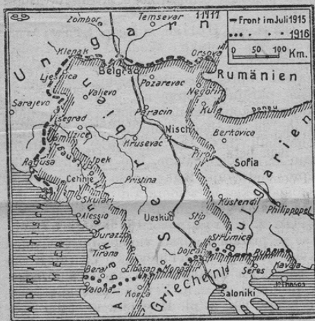
Unsere Front auf dem Balkan nach 2 Jähr. Kriegszeit.

Prinašamo mali zemljevid v poštev prihajajočih pokrajin Balkana, ki kaže z debelo črto (-----) fronto v juliju 1915, s punktirano (.....) pa fronto v juliju 1916. Karta bode cenjene čitatelje gotovo zanimala, ker nam kaže jasno, da je najpomembnejši del Balkana v naših in naših zaveznikov rokah.