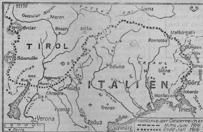
Frontkarte der Oesterreicher gegen Italien

Somišljeniki, bodimo složni in bijmo boj proti nesramnim sovražnikom in vampirjem ubogega ljudstva!