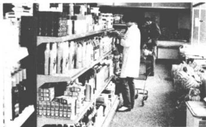
V občini vprašanje osnovne preskrbe še vedno ni zadovoljivo rešeno