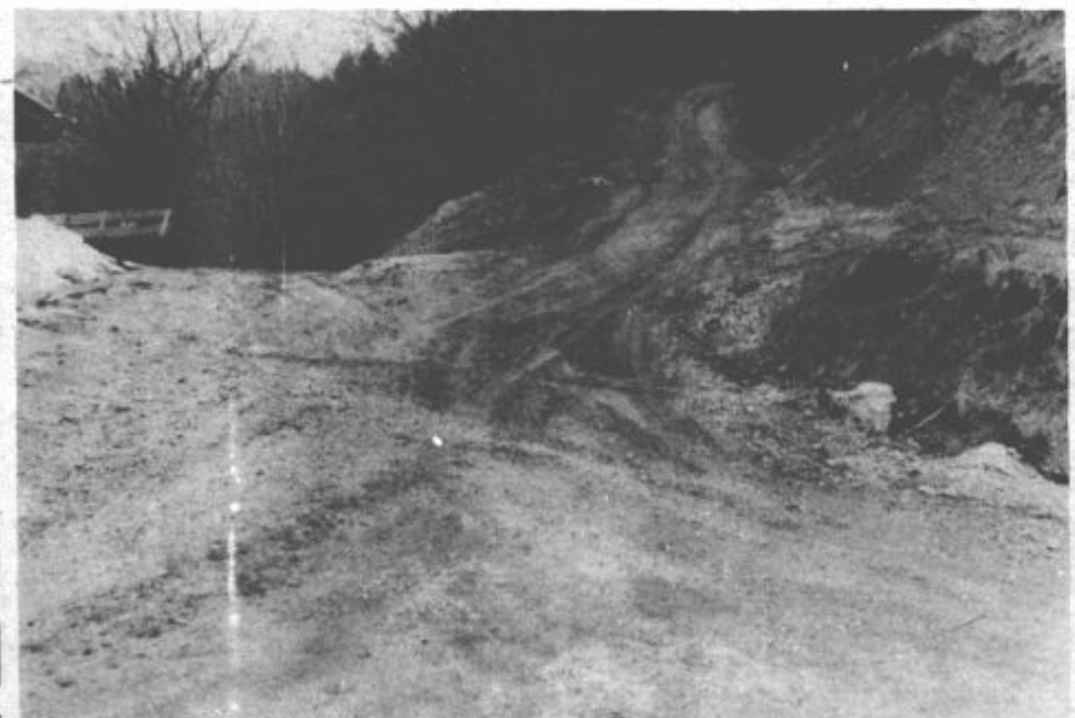
Referendumska sredstva zadoščajo le za vzdrževanje cest