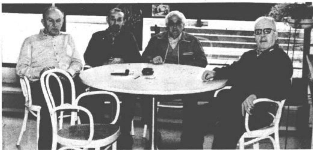
V domu živijo varovanci kot velika družina

Današnji tempo in način življenja onemogočata, da bi starši preživljali jesen svojega življenja skupaj z otroki. Stanovanja so majhna, zaposlene pa so tudi žene, tako da te ne morejo skrbeti za svoje starše oziroma sorodnike. Tako se zadnja leta vse bolj kaže potreba po organiziranem domskem varstvu starejših oseb. Vendar pa je potrebno povedati, da temu vprašanju v preteklosti v naši družbi nismo namenili veliko pozornosti. Domovi za varstvo odraslih so bili pretežno v starih stavbah, v njih pa so živeli pretežno le tisti ljudje, ki niso imeli nikogar svojih, sami pa niso bili več sposobni, da bi skrbeli zase. Prav zaradi tega je še vedno zakoreninjena miselnost, da so starejši ljudje, ki morajo v domove za varstvo odraslih, nekako zavrnjeni, odrinjeni. No, vseeno pa lahko trdimo, da se ta miselnost le spreminja, saj odpiramo nove domove, kjer se ljudje dobro počutijo.