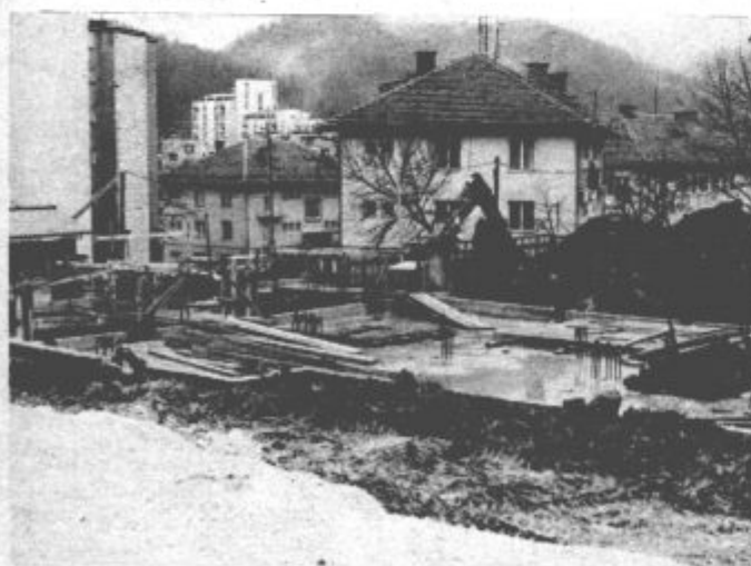
V Velenju so pričeli ob koncu preteklega leta zidati prizidek k domu za varstvo odraslih ob Kidričevi cesti. Izvajalec gradbenih del je velenjski Vegrad, dela pa naj bi končali konec letošnjega leta. Investitor mora zagotoviti še finančna sredstva za opremo, prizidek, v katerem bo 60 novih mest, pa naj bi predali namenu prihodnje leto. Več o tem na 5. strani

Prejšnji teden je bila v Velenju na obisku delovna skupina predsedstva Zveze socialistične mladine Slovenije. Člani delovne skupine so obiskali osnovno organizacijo ZSMS v tozdu Štedilniki (TGO Gorenje), ter se pogovarjali o aktualnih problemih, ki tarejo mlade iz naše občine pri njihovem vsakdanjem delu in življenju. Spregovorili so o družbenoekonomskih problemih, s katerimi se srečuje združeno delo v naši dolini in nalogah, ki jih mora mlada uresničiti, dotaknili so se problemov zaposlovanja in vzgojno izobraževalnega sistema ter spregovorili o sistemu obrambe in zaščite. Po pogovoru so si člani delovne skupine ogledali del proizvodnje TGO Gorenje ter se seznanili z delovnimi pogoji delavcev te tovarne.