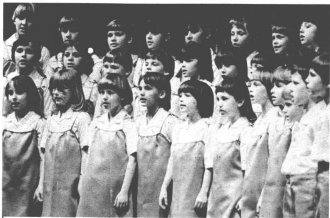
Letošnja zima je bila dolga in huda, zato smo vsi že komaj čakali pomladi, ki se začneja z današnjim dnem. Upamo, da bo tako dosledna kot zima z mrzom in snegom, torej polna sonca. Tudi sobotno srečanje mladih pevcev velenjske občine je bilo pomladansko obarvano, saj so nas mladi navdušili s svojo živahnostjo in lepimi pesmimi.

Mnenje vseh občin je tudi, da posebnih koordinacijskih odborov za preobrazbo pravosodja v