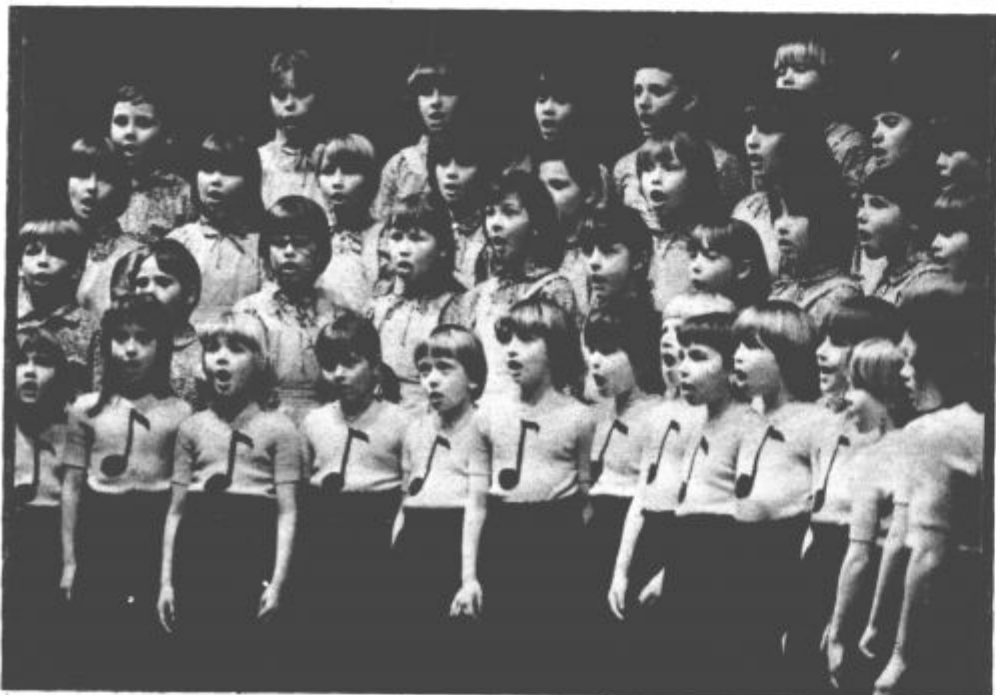
Pelo je več kot 700 mladih pevcev

Tudi letošnje srečanje sta organizirala Zveza kulturnih organizacij občine Velenje in glasbena šola Fran Korun Koželjski Velenje. Prihodnje leto bo srečanje morda še pomembnejše, saj bo slavilo že srebrni jubilej. S. V.