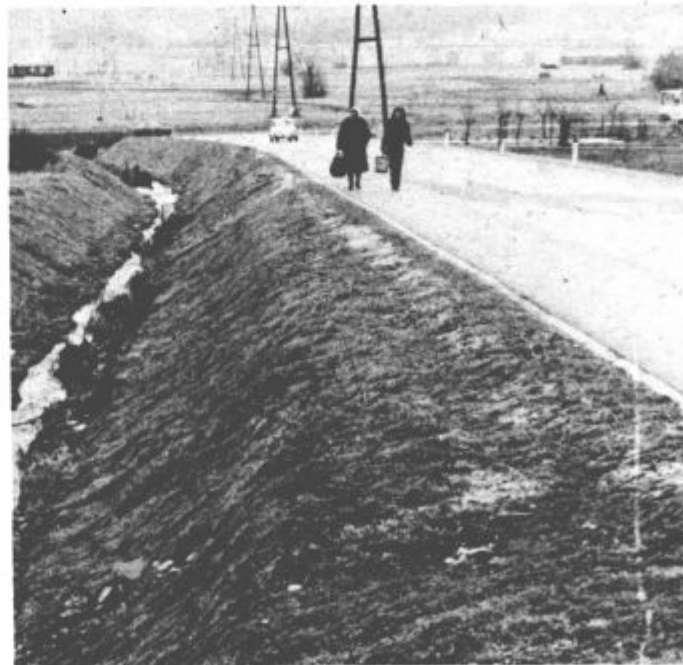
Ko so gradbena dela zaključena, nastopi z deli delovna enota Hortikultura, ki da objektu končno podobo