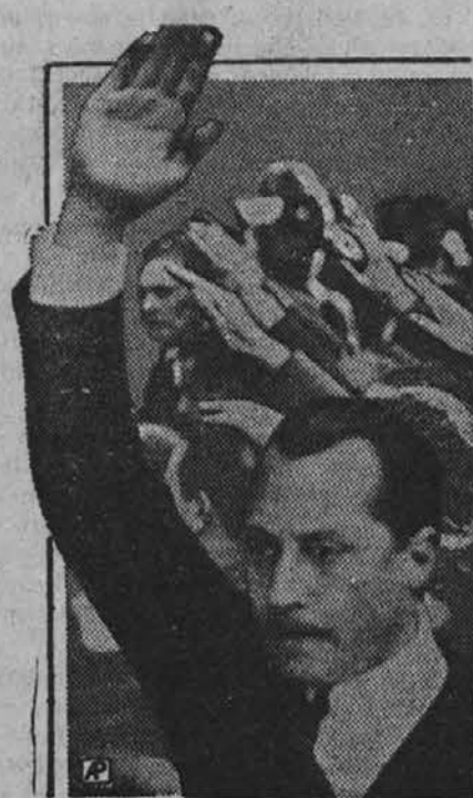
Vodja španskih fašistov Primo de Rivera, sin bivšega diktatorja

Potem so presadili rakovo tkivo v telo živali iste vrste, kakor je ona, ki so ji to tkivo izrezali. V takšnih okoliščinah se rak silno naglo razširi. Tako na primer doseže kos tkiva z rakom obolele miši že nekaj tednov po presaditvi rakovih celic teho petih gramov. Ta množina se da razdeliti na sto delov in presaditi na sto miši. Če ta postopek ponovimo pri vsaki živali, si nabereimo, preden je leto okoli, več ko 400.000 kil rakovega tkiva. Iz tega vidimo, kako strahovito naglo se rak