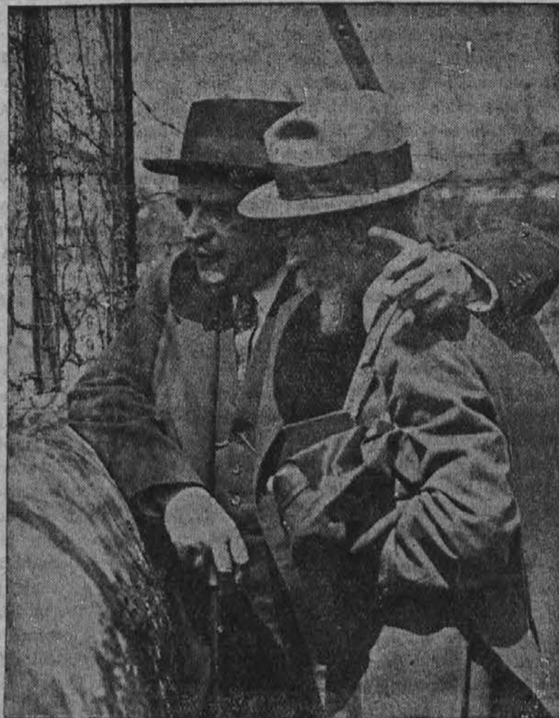
Znani francoski politik Herriot (s črnim klobukom) se razgovarja s svojim prijateljem od radikalno socialistične stranke

Iz Brd poročajo, da se je pred nekaj tedni obesil neki kmet iz Snežatnega, občina Kojsko zato, ker ni mogel plačati zapadle menice. Kmet ki je svojčas bil dobro stoječ je prišel tako daleč, da si je moral, če se hotel obesiti, sposoditi vrvo. Beneški dnevnik "Gazzettino", ki je po Goriskem zelo razširjen, je poročal, da je kmeta zadela kap. Oblastva zakrivajo kolikor morejo, da ne pridejo taki slučajji v javnost.