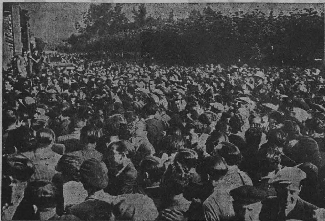
Velike protestne manifestacije Kataloncev v Barceloni radi spora z Madridom

To je žalostno, dragi moji! Žalostno, ker le prevečkrat