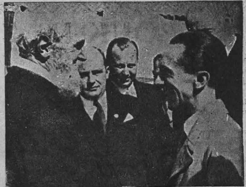
Goebbels, nemški minister za propagando, tekem svojega obiska v Varšavi (na desni)