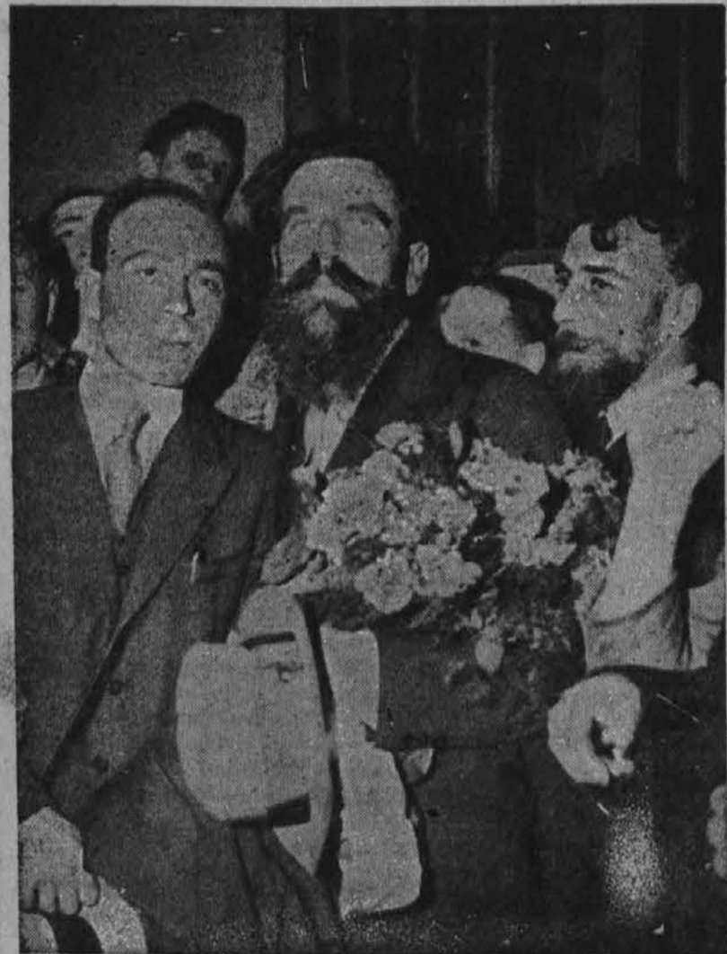
Ruski profesor Schmidt, vodja Čeljuskinove ekspedicije, je prišel na obiske v Pariz

JARMIENTO 1017 ORDINIRA OD 10 DO 12 i 14 DO 20 SATI