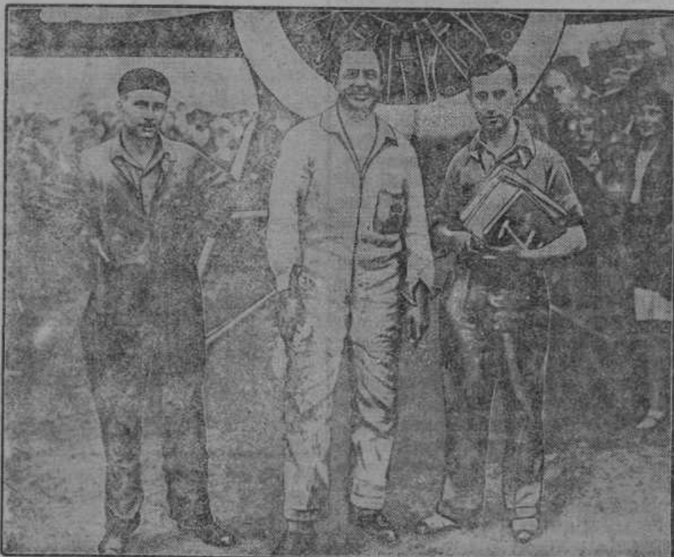
V 6 dneh iz Angleške v južno Afriko. Angleški letalec Glen Kildoston po preletu iz Angleške v Kapstadt (13.700 km).

pravilno uredimo zavarovanje. Pišite mi dopisnico. V drugih krajih pa se obrnite na krajevnega zastopnika »Vzajemne zavarovalnice v Ljubljani.« — Franjo Žebot.