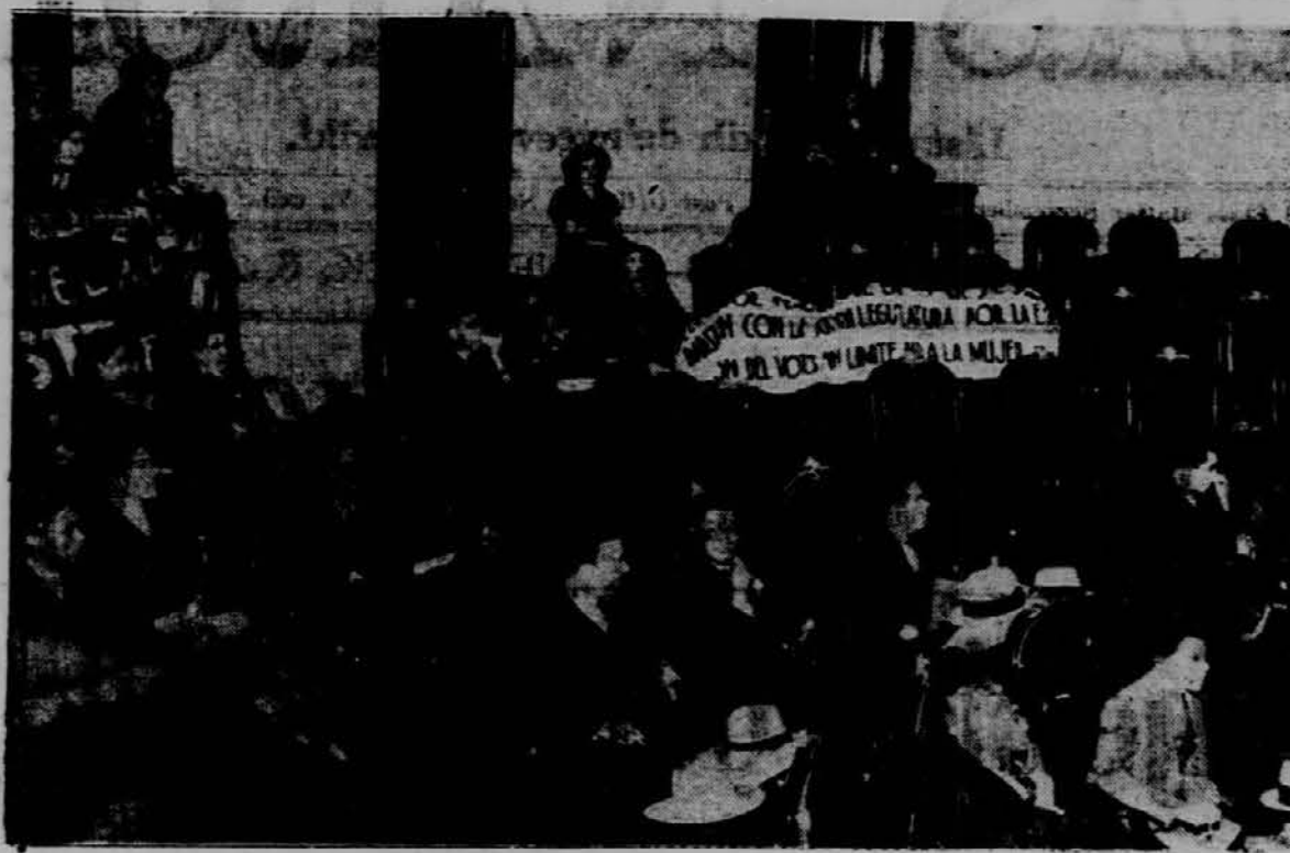
Kot je razvidno s slike, ki pred stavlja mehiško poslansko zbornico, je med poslanci tudi nekaj žensk, ki se vdejevajo v političnem življenju.