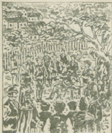
Vidnanič kaže seljanom moč „Pakraških kapljic in Slavonske biljevine.“

v Kandiji št. 26 se takoj odda. Natančneje ravno tam.