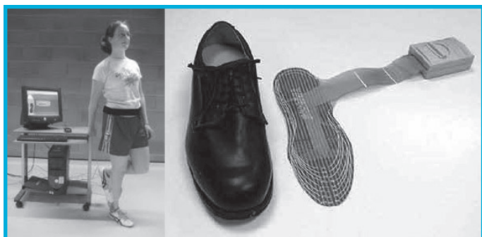
Slika 1: Sistem F-Scan za meritev stopalnih pritiskov.

sistema F-Scan Version 5.0 (Tekscan Inc, Slika 1). Sistem omogoča merjenje navpične komponente sile, ki deluje na stopalo med hojo. Vložki so zelo tanki (debeli 0,18 mm) in bolnika pri hoji ne motijo niti ne ovirajo. S pomočjo pripadajoče programske opreme TAM ( ang. Timing Analysis Module) smo ocenili povprečne maksimalne pritiske na sedmih mestih na stopalih: blazinica palca, glavica I., II., III., IV. in V. stopalnice, srednji lateralni del stopala in peta. Po navodilih proizvajalca sistema za merjenje smo iz analize izključili prvi in zadnji korak, program pa je izračunal povprečje pritiskov preostalih korakov (22).