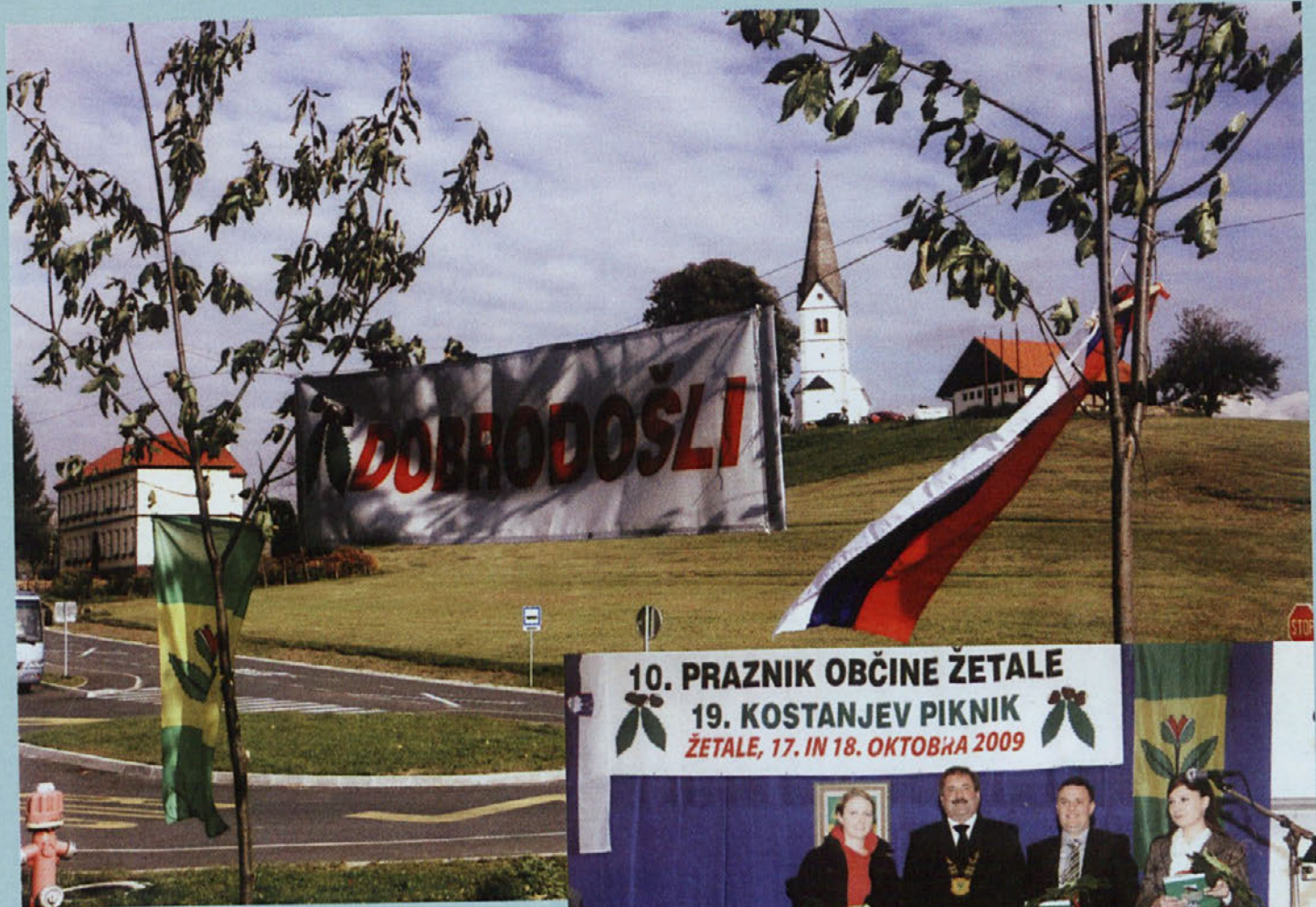
Dobrodošli na občinskem prazniku