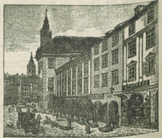
(Die Apotheke besteht seit mehr als 130 Jahren.)