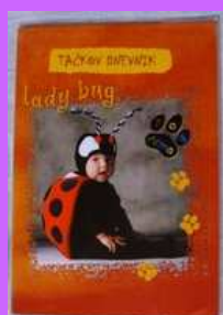
Slika 5: Predstavitev projekta Beremo z muckom Tačkom.

čas. Tako se je v času, namenjenemu dopolnilnemu pouku, izmenjalo več učencev, drugi pa so bili v tem času v podaljšanem bivanju. Prehajanje iz PB k dopolnilnemu pouku in nazaj je ob dogovoru z učiteljico PB potekalo brez težav.