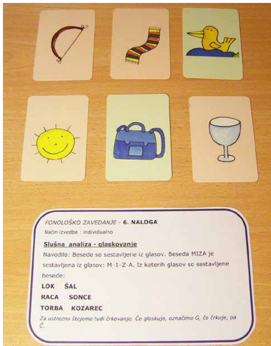
Slika 1: Izsek iz individualnega načrta opismenjevanja, ki zajema test, cilje in prostor za nadaljnje načrtovanje in spremljanje.

Prvi izziv je predstavljalo že samo ugotavljanje razvitosti veščin spretnosti in zmožnosti, potrebnih za branje in pisanje pri otroku. Na šoli sem iskala sodelavko, s katero bi se tega lotili skupaj in tako k sodelovanju pridobila