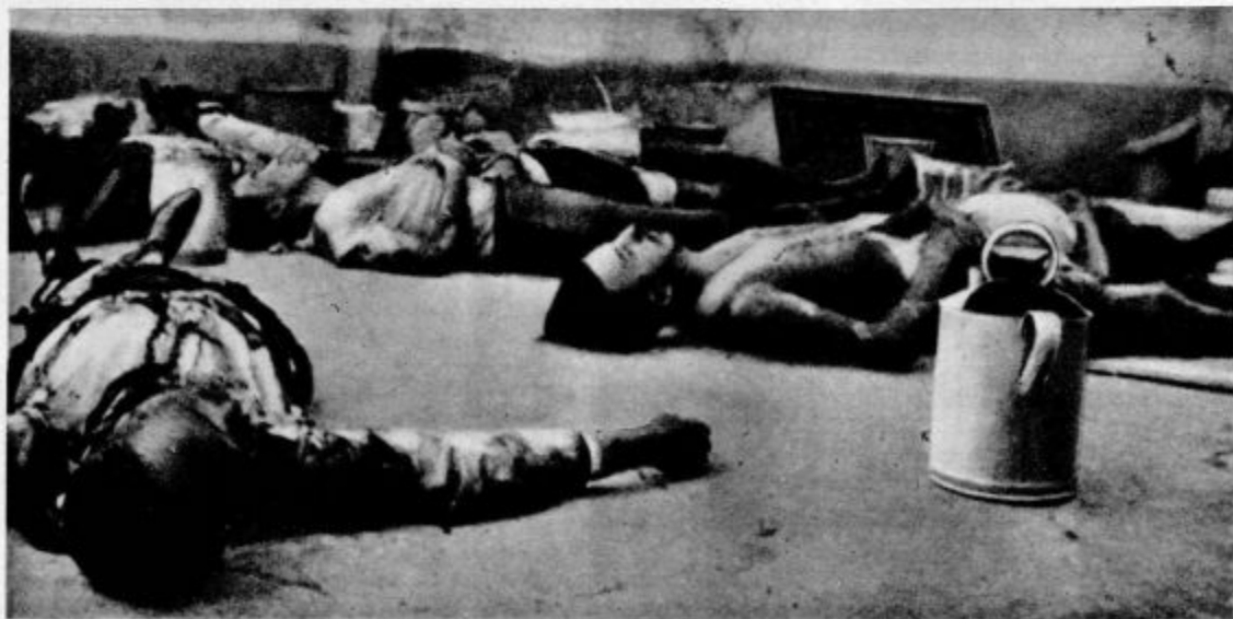
4. Žrtve rdečega terorja

V El Rahalu so našle bele čete na dvorišču jetnišnice trupla 25 umorjenih meščanov