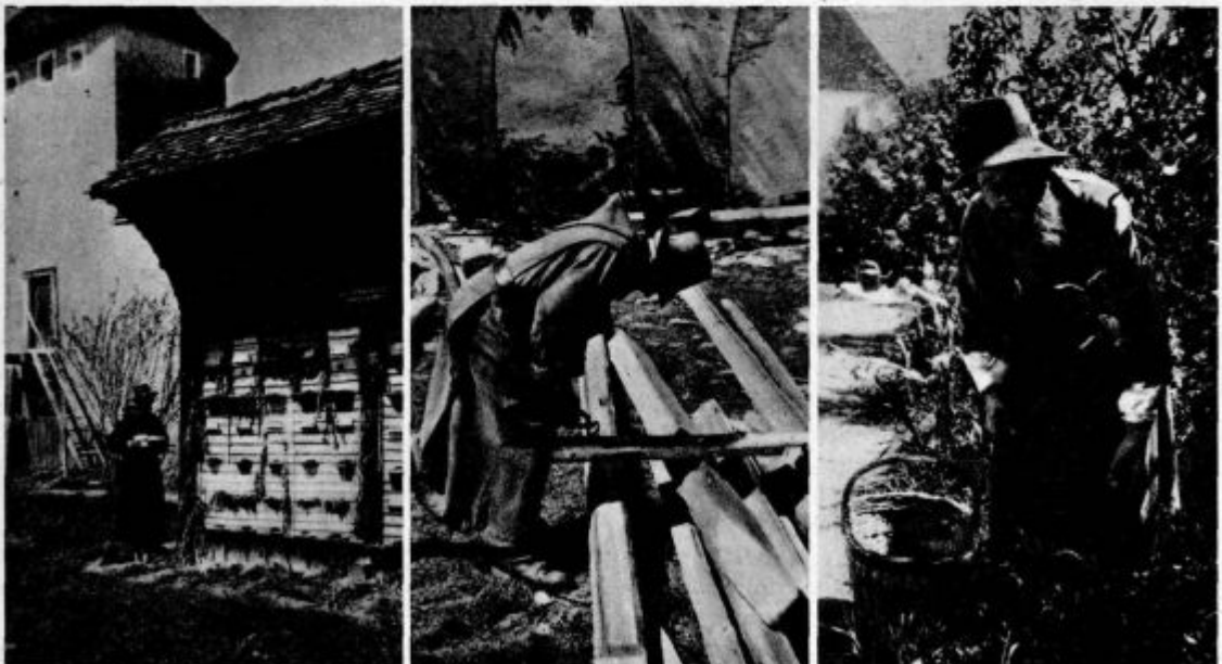
K zadnjemu članku o stiškem samostanu

Naglo sem vrgel pogled po preprosti, navadno pobeljeni celici. Torej: pisalna miza s knjigami, pult, dva stola, ob steni pa zažrnjen