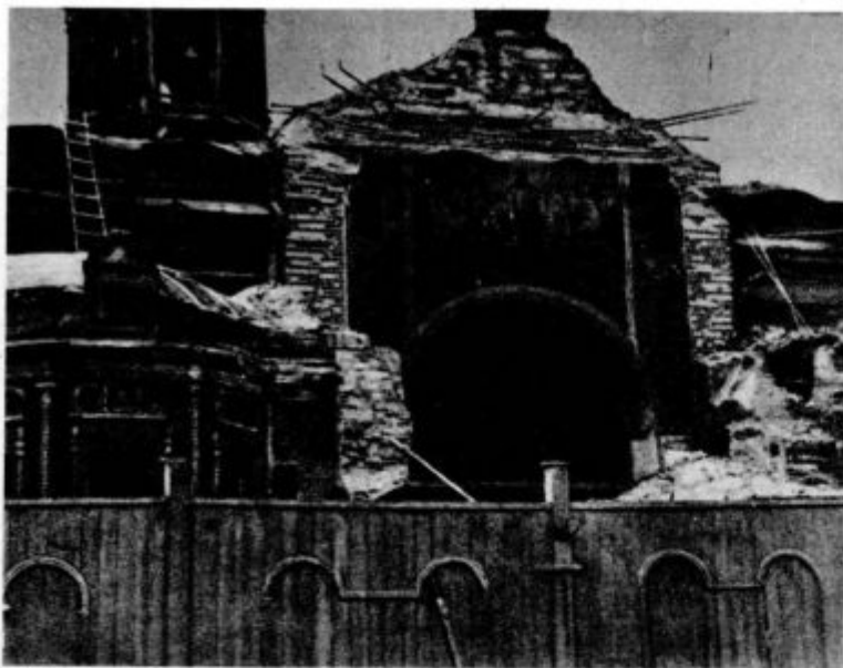
6. Razvaline pred kratkim porušene cerkve v Moskvi

čena v svečano črno, ki se je zlasti deklicama izvrstno podalo k nekoliko bledima obrazoma.