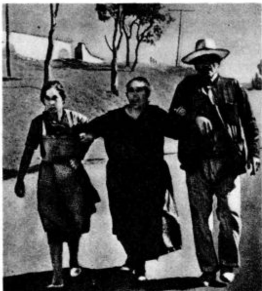
Slike iz španske prekucije: 1. Brez doma Po zračnem obstreljevanju beži španska kmečka družina iz porušene vasi. Mož in hčerka podpirata bolno ženo. Na obrazih se zrcali zbeganost in strah

posteljnak, klečalnik z razpelom, omara in v kotu lončena peč.