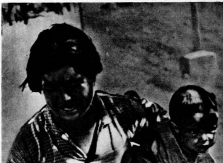
2. Španska mati z otrokom na begu pred bombami Vse neizmerno gorje odseva z obraza nesrečne matere; še na otroku se vidi, da sluti, kako je hudo

»Ali so vse celice zasedene?« — mi je ušlo z jezika.