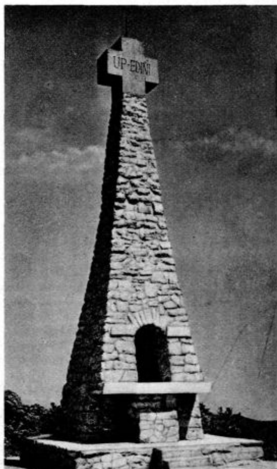
Križ na Donački gori

Torej naš Stvarnik in Posvečevalec hoče resno, da se to božje semenje v nas razvije do konca, do popolnosti — taka je njegova neomajna volja, njegova postava, njegova zapoved, to je namen božjega semena v nas. Seveda se bo razvilo zopet samo s tvojim sodelovanjem — taka je zopet njegova odredba, To je tvoja največja, najvišja, najodličnejša, tvoja prva življenjska naloga. To velja tebi, kdorkoli si. Ne samo papežu, ško-