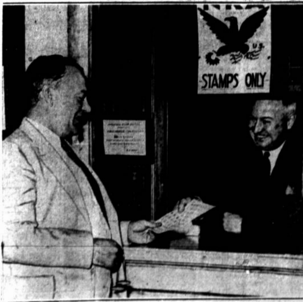
Hugh S. Johnson, industrijski administrator, je bil prvi, ki je kupil nove poštne znamke z znakom Nire. Prodal mu jih je glavni poštar Farley (na desni).