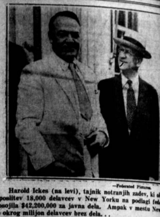
Harold Ickes (na levi), tajnik notranjih zadev, ki obil uposilev 18,000 delavcev v New Yorku na podlagi feder posojila $42,200,000 za javna dela. Ampak v mestu New je okrog milijon delavcev brez dela.