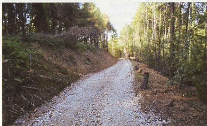
Modernizacija ceste v okviru projekta Južna meja v Ložini

OPERACIJO JE DELNO SOFINANCIRALA EVROPSKA UNIJA, EVROPSKI SKLAD ZA REGIONALNI RAZVOJ NALOŽBA V PRIHODNOST