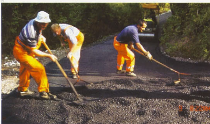
Rekonstrukcija ceste Jablovec-Writzl