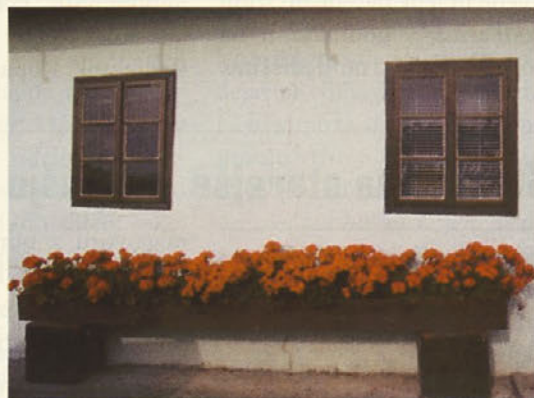
Dežno pri Podlehniku 37