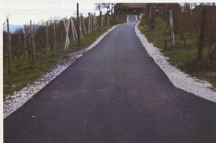
Rekonstrukcija ceste Podlehnik–Križ–Drevenšek

OPERACIJO JE DELNO SOFINANCIRALA EVROPSKA UNIJA, EVROPSKI SKLAD ZA REGIONALNI RAZVOJ NALOŽBA V PRIHODNOST