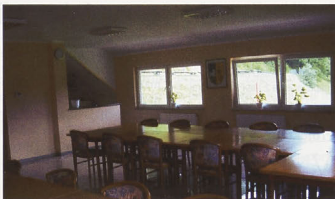
Novi zgornji prostori športnega objekta v Dežnem