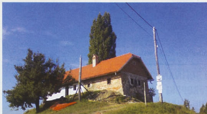
Nova streha Viničarskega muzeja na Gorci

Zaradi nujnosti zaščite objekta pred nadaljnjim propadanjem smo na pobudo Zavoda za varstvo kulturne dediščine Slovenije začeli obnovo te znamenitosti. Izdelali smo projekt sanacije. Obnovili in razširili smo klet ter objekt