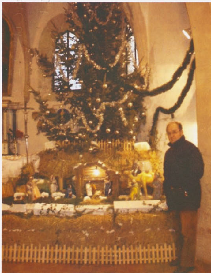
Jaslice sv. Duh v Halozah

Prijetne, doživete, mirne in vesele božične in novoletne praznike.