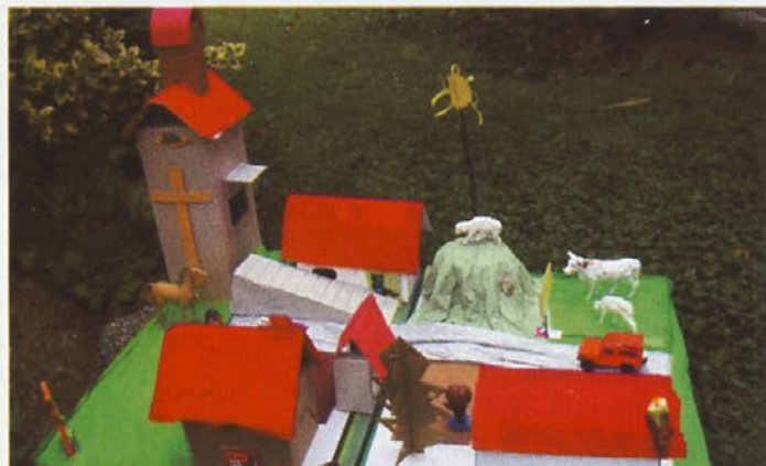
Režkov ideal - Haloze kot v pravljici / Maketo »Moj domači kraj« izdelala A.C. Ban

Mlademu inovatorju, ki je kot občan Občine Podlehnik s svojim izumom, za katerega je na državni ravni prejel tako visoko priznanje (zlato plaketo s področja Eureka – Inovacije mladih 2009) in s tem bistveno pripomogel tudi k promociji, uveljavitvi in prepoznavnosti naše občine, iskreno čestitam in želimo še mnogo inovativnega duha.