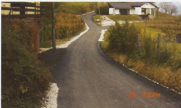
Rekonstrukcija ceste Jablovec-Vrečar