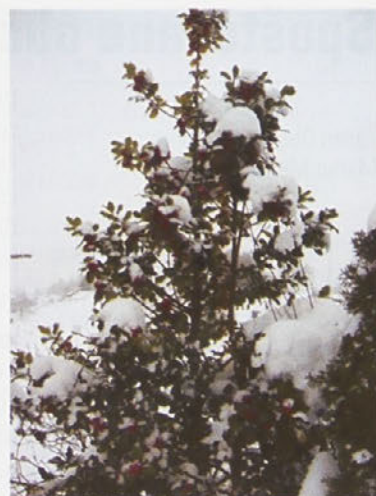
Božje drevice