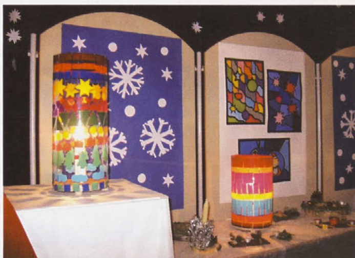
Praznične ustvarjalne delavnice učencev OŠ Podlehnik, december 2009