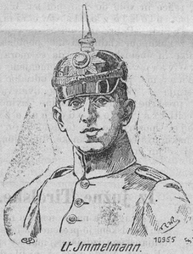
Lt. Immelmann. 10955

Najznamenitejši nemški letalec oberlajtnant Immelmann, katerega sliko danes prinašamo, je pred kratkim na polju časti našel junaško smrt letalnega oficirja. Ime tega junaka ostane neizbrisljivo v zgodovini svetovne