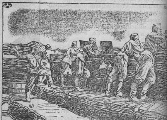
Österr. unq. Truppen mit Larven gegen russische Slinkqase gesch

Iz strahu pred sodnijo obesil se je v bolniš kemu, skem posloju v Dellachu neki fant naj si terega so v gozdu aretirali in ki bi s da pr moralo sodniji izročiti. P