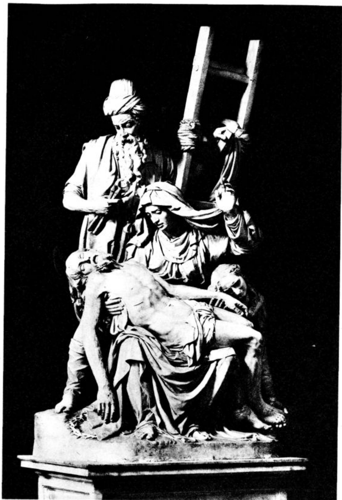
Jezusa snamejo s križa