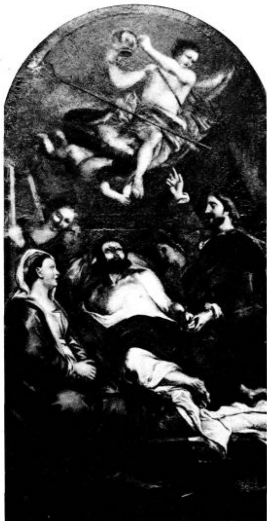
Sv. Jakob v Ljubljani

Krščanski zakon nadalje ni navadna, četudi nerazrešljiva pogodba med možem in ženo, ampak je po Kristusu povzdignjen v nadnaravni red k visoki časti sv. zakramenta. Zato je tem bolj umljivo, da se mora po besedah velikega papeža Leona XIII. Cerkev z grozo odvracati od mešanih zakonov, ki nudijo priliko za občevanje v svetih rečeh z nekatoličani. Tretji in najvažnejši razlog, zakaj Cerkev prepoveduje mešane zakone, je pa ta, kakor zopet piše papež Leon XIII., ker je v takem zakonu vera katoliškega družeta v veliki nevarnosti in je otežkočena, če ne naravnost onemogočena katoliška vzgoja otrok. Mešani zakoni le prepogosto zavedejo zakonce, da začno imeti vse vere za enako dobre, da več ne razlikujejo med resnico in zmoto. Torej nevarnost verske brezbriznosti in malomarnosti, nevarnost verskega indiferentizma! Kdorkoli veruje v poslanstvo Cerkve in pozna njene naloge, uvidi, da Cerkev mora prepovedovati mešane zakone, ki so navadno njenim otrokom v pogubo. Pa pravijo, da je Cerkev nestrpna; če je to nestrpnost, potem je nestrpna radi blaginje svojih otrok! Ko Cerkev prepoveduje mešane zakone, ne pozablja na ljubezen in ne seje nezaupanja in sovraštva, ampak obratno: ker ji je resno na tem, da bodi ljubezen med zakonskimi trajna, zato z vso ostrostjo prepoveduje mešane