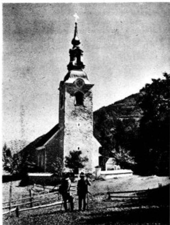
Sv. Anton na Podvolovjeku