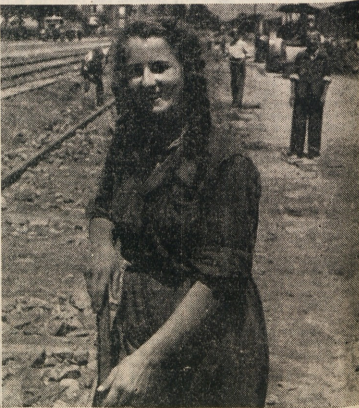
DEKLETA SO DELUJEJO SKUPNO S TOVARISI PRI GRADNJI ŽELEZNIŠKE PROGE NOVEGA BEOGRADA. NA SLIKI JE MLADA PTUJČANKA

vore. VU se doslej tudi izogiba odgovoru. Toda treba ga bo dati, ko že ne morejo in ne upajo kar samovoljno izvesti predlog od 20. marca t. l. Cim več časa bo poteklo, tem manj aktualen bo postal ta predlog. Druga značilnost je v razdelitvi sektorjev plovbe. Lloydsovo so namenili linije, ki mu jih je vsilil megalomanski simerjih po 1932 odn. 1936 in ki so za Trst najmanj primerne. Ne kaj je v tem že stare usledine v krogih mornariskega ministrstva v Rimu, drugo pa je skrb za interese Geneve in Benetk, ki je strani italijanske republike sicer razumljivo. Prav tako pa bo razumljivo, da je neodložljiva oddaljevanje Lloydov od družb FINMARE in vodstvo samostojne politike v plovi, ako naj podjetje koristi gospodarstvu matičnega mesta, ki je obenem njegov lastnik.