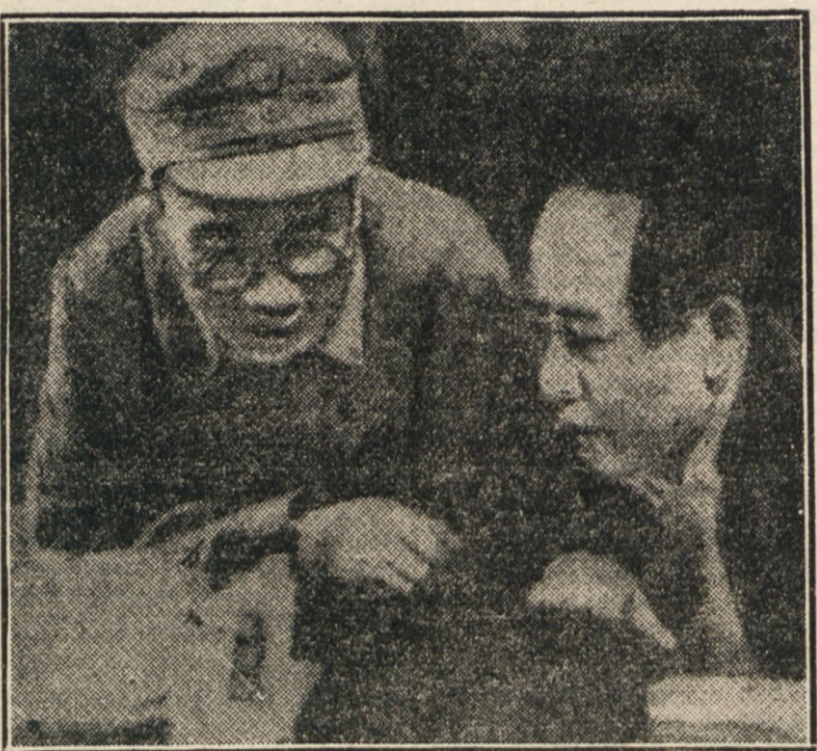
GENERALNI SEKRETAR KOMUNISTIČNE PARTIJE KITAJSKE MAO CE TUNG (DESNO) SE RAZGOVARJA Z GENERALOM CU DEHOM (LEVO), VRHOVNIM POVELJAVNIKOM ZMAGOVITIH NARODNOOSVOBODILNIH ARMAD.

Prepis vloge se istočasno dostavlja v vednost: Ministrstvu za zunanje zadeve ZSSR - MOSKVA Tajništvo za zunanje zadeve Združenih držav Amerike - WASHINGTON Ministrstvu za zunanje zadeve kraljevine Velike Britanije - LONDON Ministrstvu za zunanje zadeve republike Francije - PARIZ Ministrstvu za zunanje zadeve SSR Ukrajine - KIJEV Ministrstvu za zunanje zadeve SSR Belorusije - MINSK Ministrstvu za zunanje zadeve FLR Jugoslavije - BEOGRAD Ministrstvu za zunanje zadeve republike Poljske - VARSAVA Ministrstvu za zunanje zadeve republike Českoslovaške - PRAGA