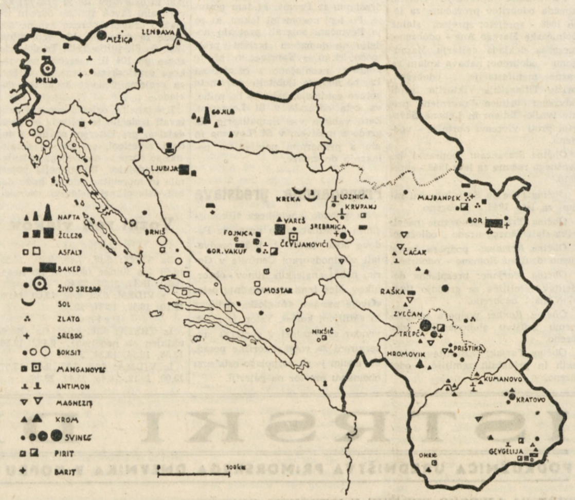
RUDNO BOGASTVO JUGOSLAVIJE. SPRICO DEJSTVA, DA SE DOBA SMOTRNEGA IZKORISČANJA RUDNEGA BOGASTVA V JUGOSLAVIJI Z NAČRTNIM GOSPODARSTVOM SELE ZACENJA, SO OZNAČENI NA KARTI POLEG ZE DELUJOČIH RUDNIKOV TUDI KRAJI, V KATERIH SO UGOTOVLJENE RUDNE ZALOGE, KI OBETAJO RUDARSKO IZKORISČANJE.

Standard Oil Company in Shell Company sta držali zelo visoke cene nafte, petroleja in bencina, ki so ga uvažale v Jugoslavijo. S pomočjo podkupljenih ministrstev bivših profilslovesnih rešitev, prav posebno pa s pomočjo kraljevske družine, sta prepričali vse poskušne, da bi se v Jugoslaviji pridobivala nafta in z izigravanjem zakona sta tako prišli do ogromnih dobičkov. Izredna prilika za posebno visoke dobičke so bile njihove rafinerije nafte v Jugoslaviji. Na osnovi carinskih tarif, ki so jo imenu imele cilj, da bi zaščitile domačo predelovalno industrijo nafte, so bili končni proizvodi mnogo bolj s carino obremenjeni kot pa surovina nafta. Tuj kapital je vplival na podkupljivo vodstvo stare Jugoslavije ne samo s tem, da je spretno izkoriščalo zakonske možnosti za velike dobičke, ampak je naravnost dikiral vedbo predpisov, ki so te dobičke naravnost omogočili. Na ta način so rafinerije, katerim so dobavljali končne izdelke pod krinko surove nafte, bile prikazane kot domača industrijska podjetja. Na ta način so tuje družbe delale bajeslovne dobičke, kapital pa ni bil niti vložen v instalacije za predelavo nafte.