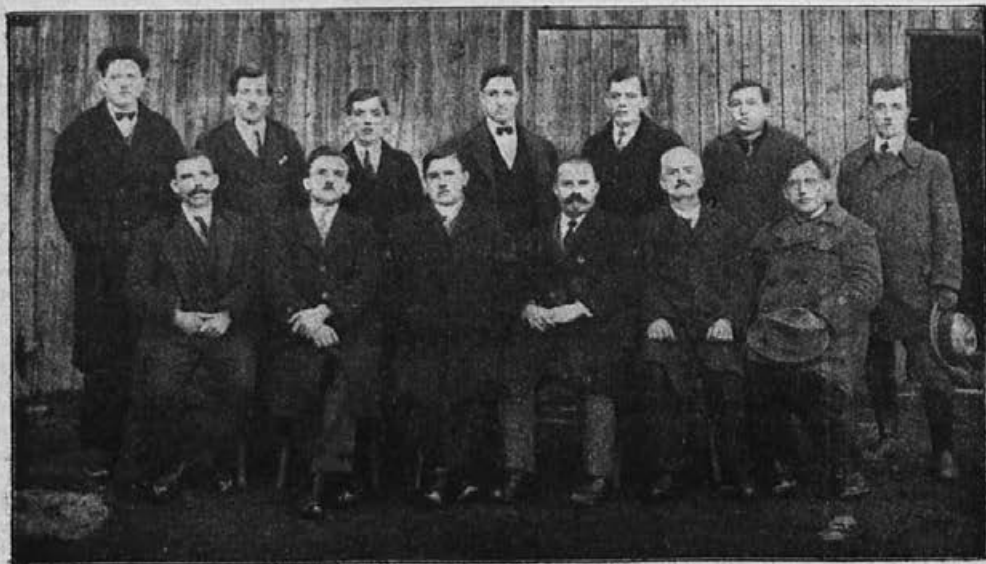
Pevski tečaj v Zagorju ob Savi (9. in 10. febr. 1927).