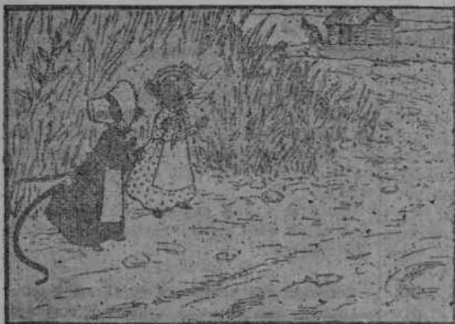
41. Miškovi prijatelji.

Ko je pehala čarovnica Miška v zapor, sta jo opazovali dve miški: Črna in Bela. Bili sta skriti v travi. Obe sta bili v strahu za Miškovo življenje. Bela pravi: »Glej no, čarovnica že odhaja iz ko-libe. Pohitiva, da videve ubogega Miška.«