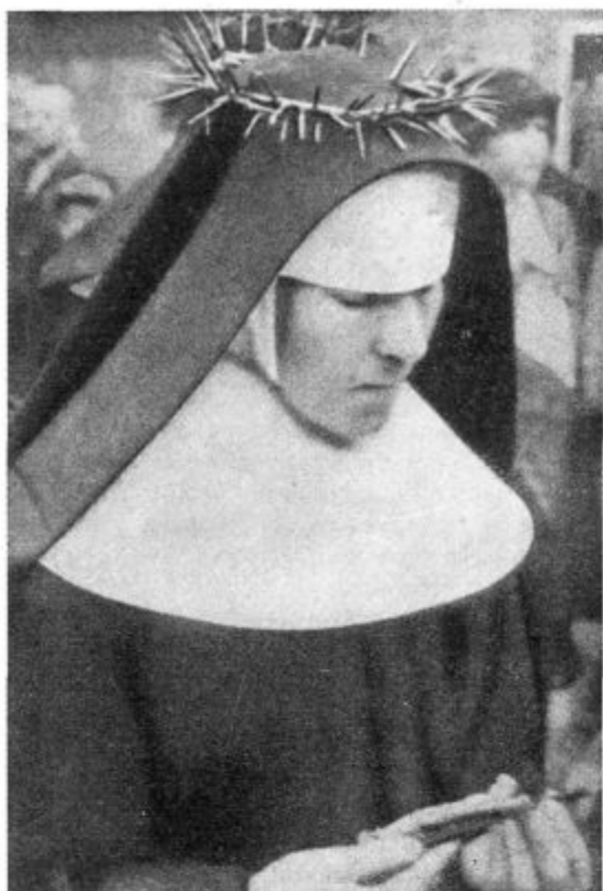
Po večnih zaobljubah.

Hilda: Toda, ali ni malo preveč zahtevano od modernega človeka, da vse te besede vzame čisto zares? Tako daleč je vse to!