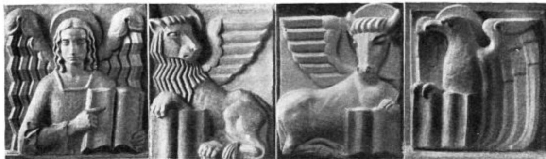
Znaki štirih evangelistov. (Glej: K našim slikam str. 61.)

srečam novega človeka, se zgane v meni veliko pričakovanje. Čakam, da se zgodi lepi čudež, — pa vselej čakam zastonj. V dobri veri se vsa žrtvujem, res, vse bi dala, — na koncu pa uvidim, da so me ljudje izkoristili. Mene in mojo dušo. Da niso vsega vzeli tako, kakor sem dala. Da so moje dejanje razlagali narobe. Da sem jim bila ljuba pesem za ljubo urico mehke praznine, — nič več.