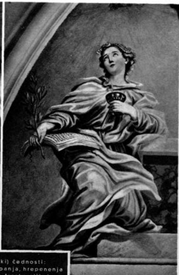
Simboli (znaki) čednosti: trpljenja, vere, upanja, hrepenenja (ljubezni) — po fresko-slikah v ljubljanski stolnici. (Slikal Julij Quaglio.)