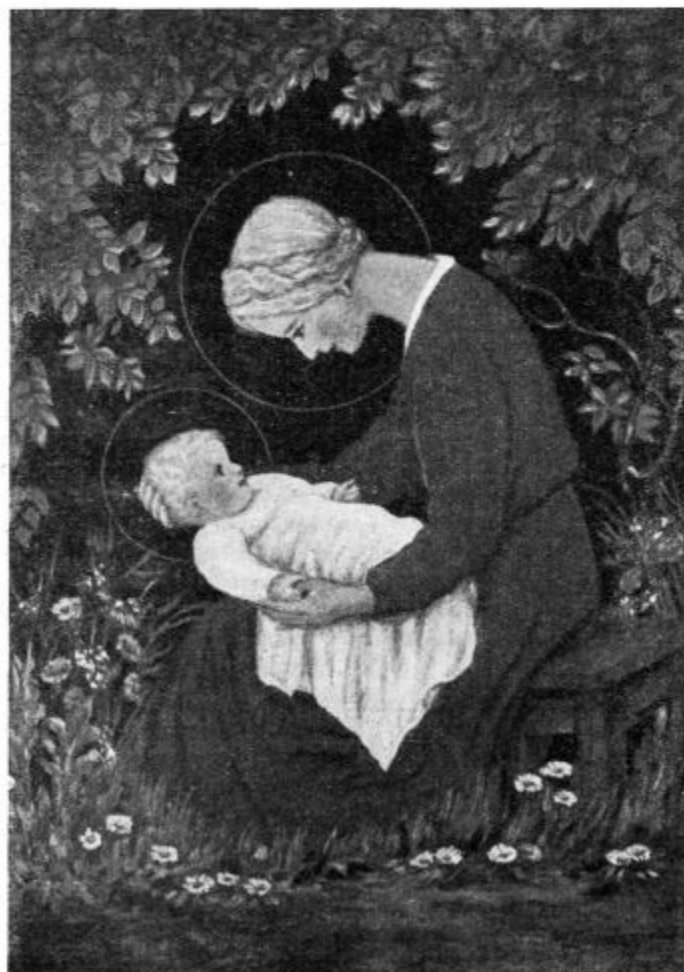
O Devica izvoljena, v rokah nosiš Jezusa, ki je Stoarnik tvoj.