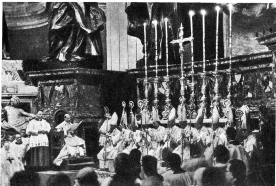
12 novih misijskih škofov, ki so bili posvečeni v Rimu na praznik Kristusa Kralja 29. okt. 1939.