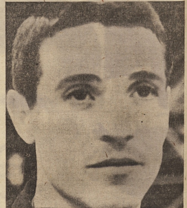
Djerdja: košarka je atraktivna igra

● in končno, treba je prejeti ali slej spraviti v sklad naše prvenstvo z vsemi ostalimi tekmovanji, ki jih organizira FITBA, mednarodna košarkarska federacija. Tu mislimo na priprave naše reprezentance za svetovna in evropska prvenstva, na tekmovanje za pokal evropskih prvakov, skratka, gre za vsa srečanja, ki so v organizaciji FIBA. Doslej smo imeli prav s tem precejšnje težave in tudi neljube zastoje. Priprave naših reprezentantov sredi tekmovalne sezone, ne vplivajo najbolje na košarkarske kolektive, ki ostanejo brez igralcev - reprezentantov. M. L.