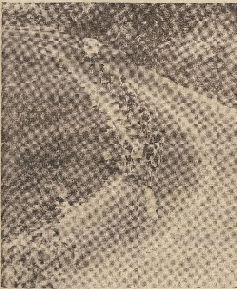
Posnetek s kolesarske dirke »Po Jugoslaviji«

Ljubljana, ponedeljek, 26. julija 1965 — Cena 50 din