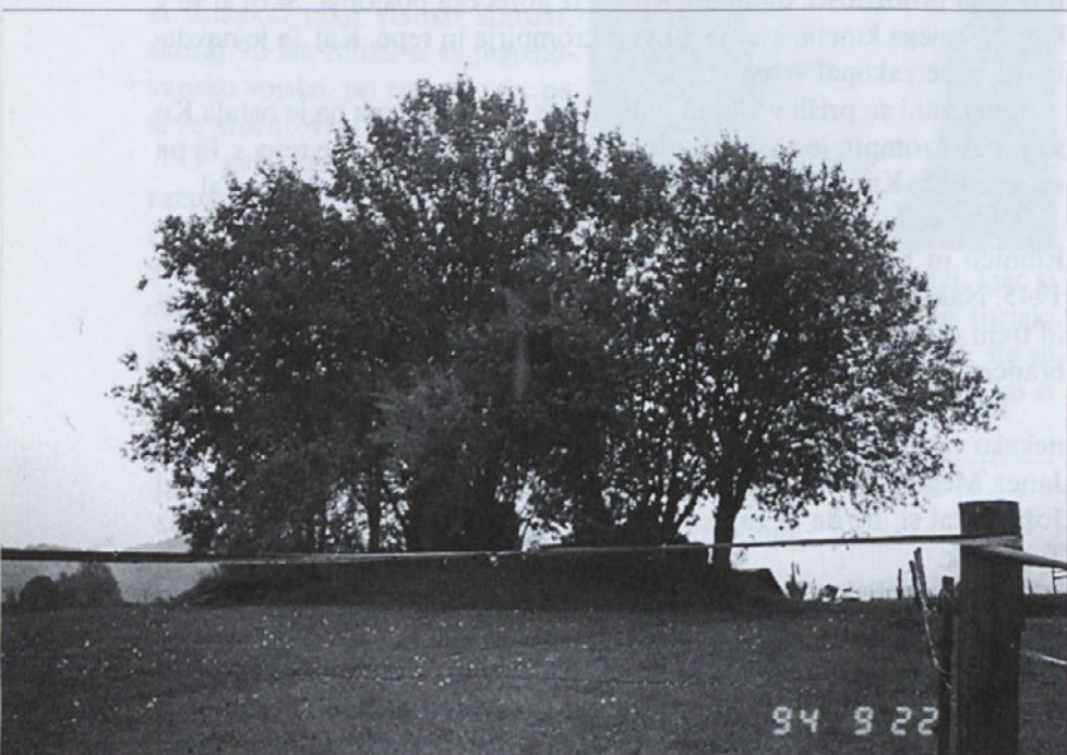
Pred čiščenjem ruševin podrte cerkve Sv. Križa v Mozlju. Med drevjem se vidi odsev križa ...