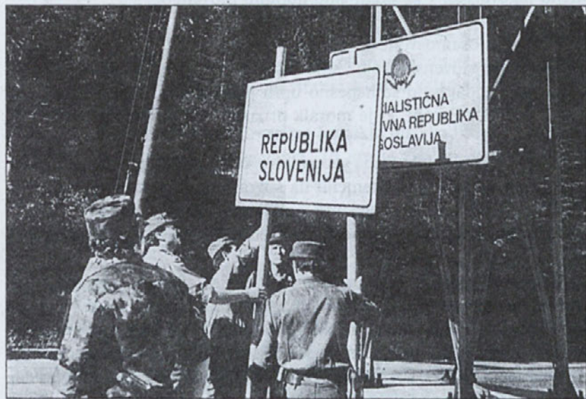
iz knjige Vojna za Slovenijo

Ideja o samostojni Sloveniji je bila v komunistični državi bogokletna, njeni nosilci pa obravnavani kot separatisti in sovražniki. Kljub temu so jo domovinsko, demokratično in državnotvorno misleči ljudje različnih političnih prepričanj v nedemokratičnih razmerah uveljavljali naprej: pisatelji, intelektualci, Slovenci doma, v zamejstvu in po svetu.