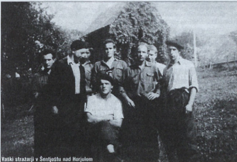
Vaski stražarji v Šentjoštu nad Horjulom

Nastanek teh straž pa je ogrozil tudi položaj partije in partizanstva.