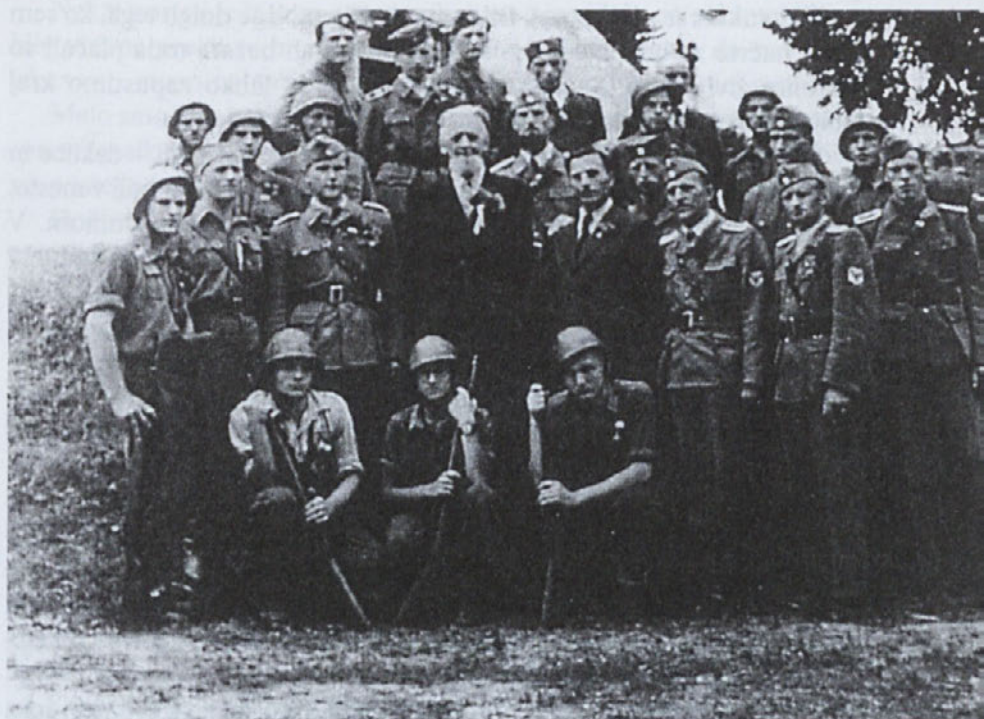
Šentjoški domobranci z generalom Rupnikom.

poljubili, ena na eno stran obraza druga na drugo stran. Tinca je imela solze v očeh.