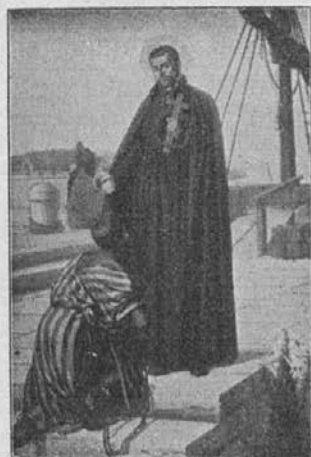
Sv. Peter Klaver, apostol zamorcev, prosi za nje in za naše podjetje!