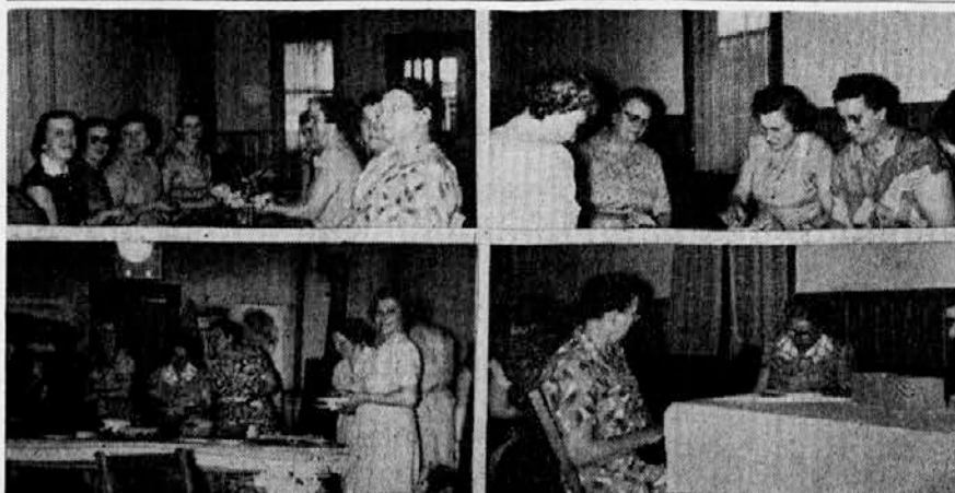
Officers and members of Branch no. 34, Soudan, enjoy a "pot-luck" supper and social.