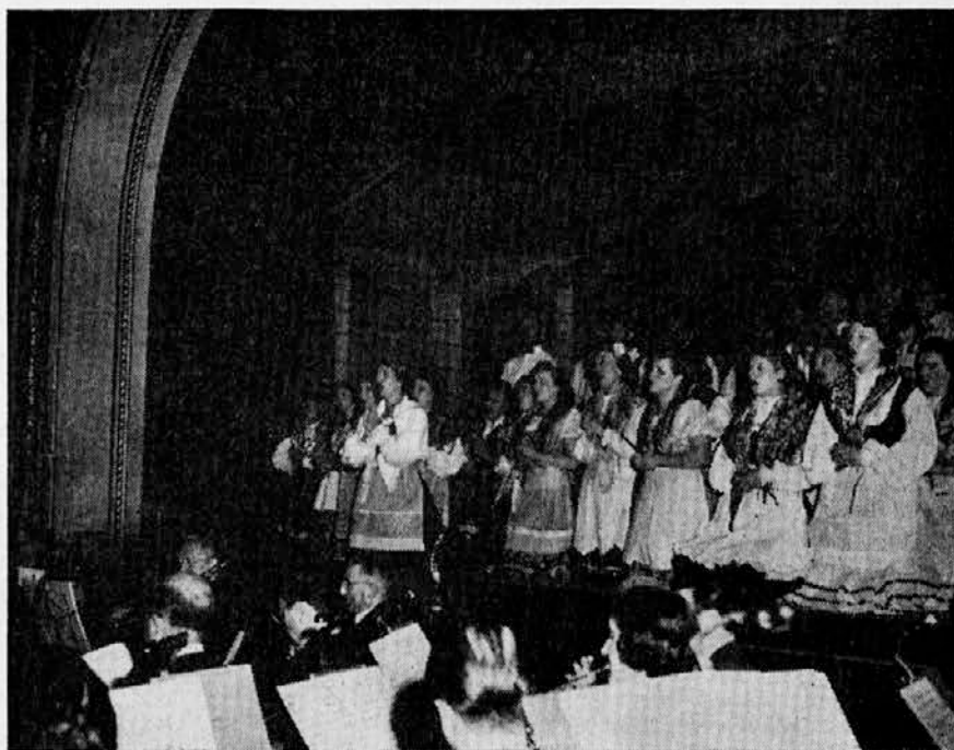
Scene from "Cavalleria Rusticana," when chorus kneels to sing the famous, Ave Maria. Cleveland Symphony Orchestra is seen in foreground.