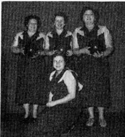
So. Chicago Champs

(If preferred whipping cream can be used instead of the whipped evaporated milk.)