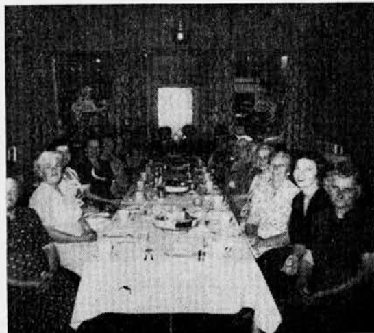
Members of Branch no. 83, Crosby at their Banquet, celebrating their 17th Anniversary.

The attendance of over 2000 pilgrims at Zveza Day in Lemont on July 18th was representative of seven States and many branches. A brief report of the day's activity will be made in the September issue.