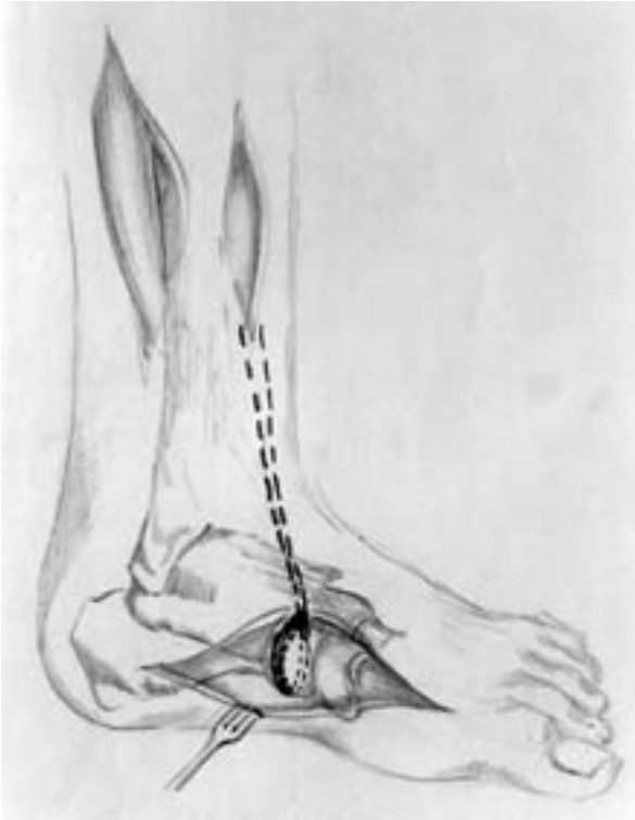
Slika 3. Modificirana metoda transpozicije kite mišice tibialis posterior. Prenos kite skozi tunel v čolničasti kosti in šiv »kita na kito«.

Pri ocenjevanju uspešnosti posega smo upoštevali 5 pokazateljev: