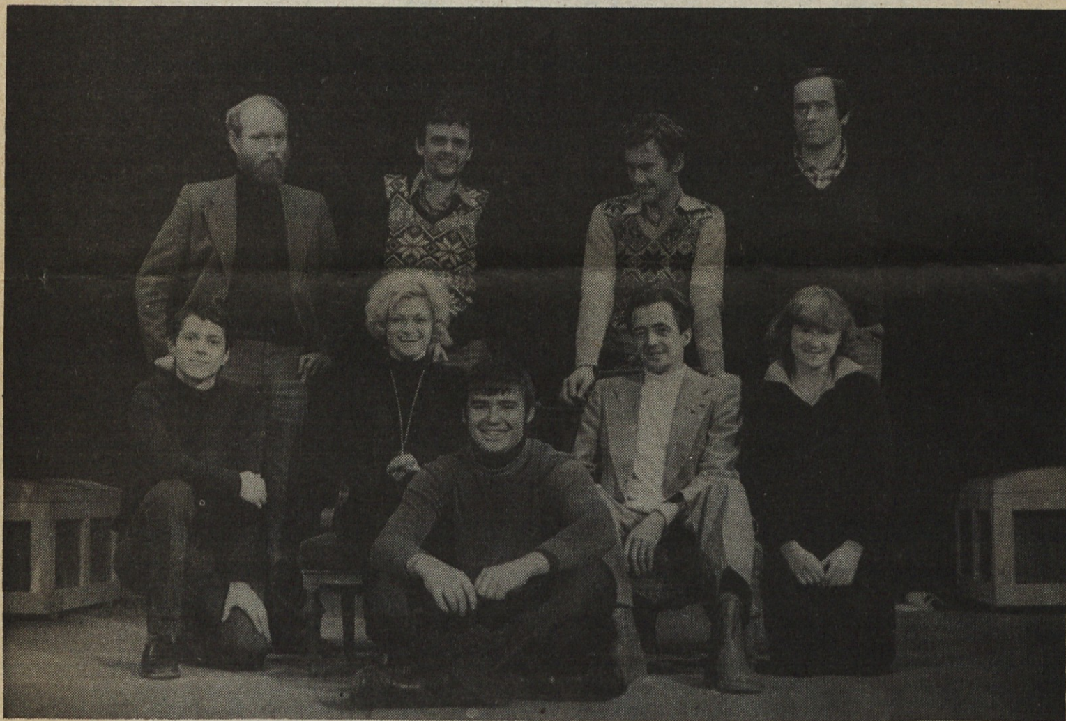
Družinski posnetek Kralja v časopisu še pred premiero