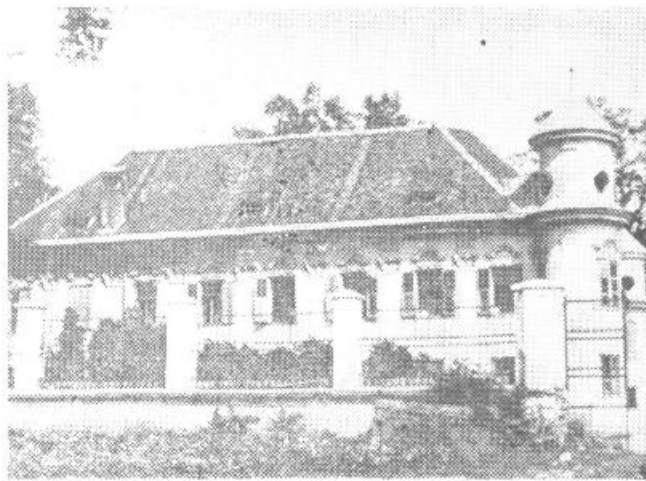
V GRADU GORIČANE pri Medvodah si lahko vsak dan (razen ponedeljka) med 9. in 12. ter 14. in 18. uro ogledate razstavo kitajske umetnosti in afriških šeg in običajev.

Še malo in vstopili bomo v svetovno leto turizma. Z ukinitvijo viz bomo na široko odprli vrata tujemu turizmu in s tem večjemu dotoku – deviznih sredstev.