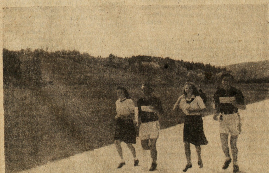
Stafeta Zveze mladine za Slovensko Koroško v St. Jakobu dne 27. aprila 1947

Če bo med Slovenci taka složnost, bo vzcvetela naša domovina in postala močna, da je ne bo uničil noben sovražnik, pa če bi prišel še s takimi silami.«