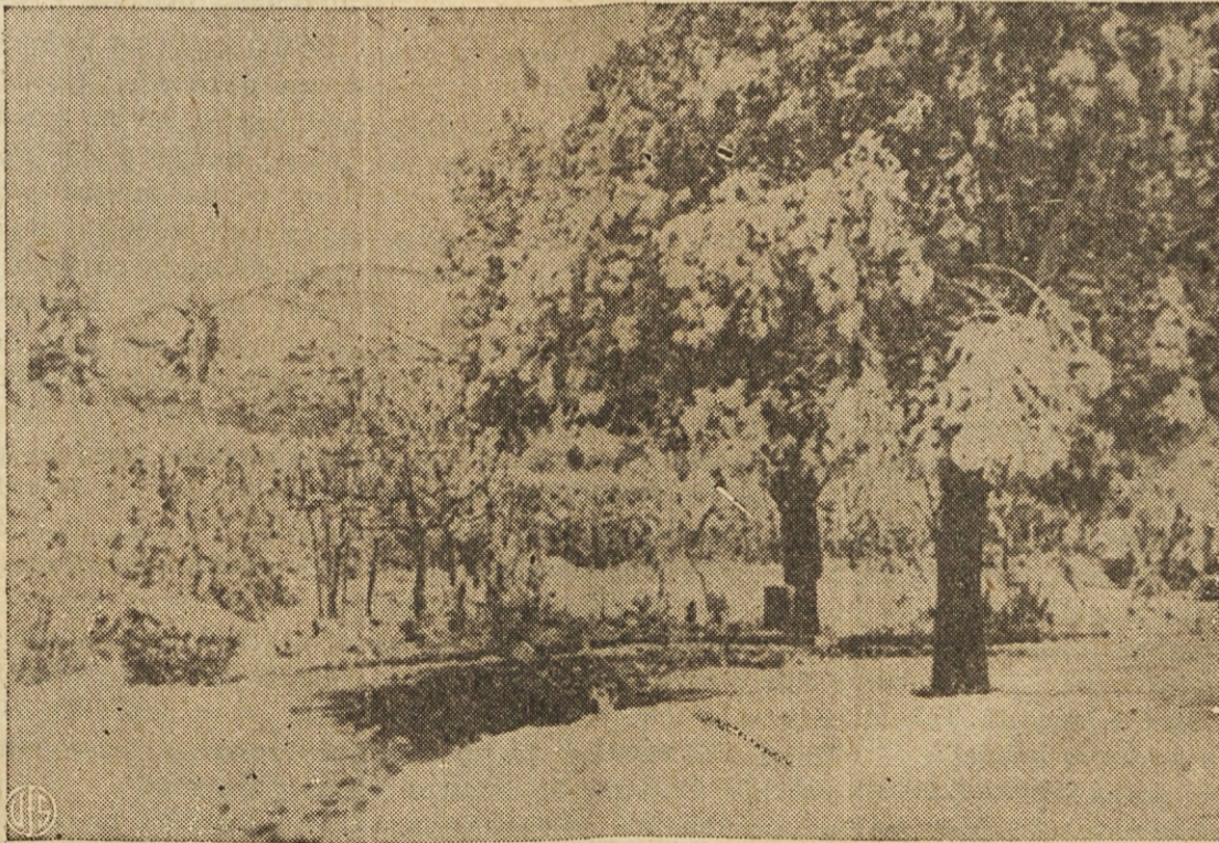
O, DA BI BILI ZDAJLE V ARGENTINI — Pogled na tole zasneženo pokrajino v gorah blizu Cordobe v Argentini vzbudi marsikomu na severni strani ekvatorja željo, da bi bil zdajle tam. Med tem ko mi v Sev. Ameriki vzdihujemo in si brišemo pot v poletni vročini, imajo v Argentini zimo. Cordoba je videla letos sneg po dolgih letih.

CHICAGO. — Otvoritveni govor demokratske konvencije je imel Paul A. Dever, governer države Massachusetts, ki je označil republikansko stranko oziroma njeno konvencijo kot "glas fosilov" (starih okamenelih živali).