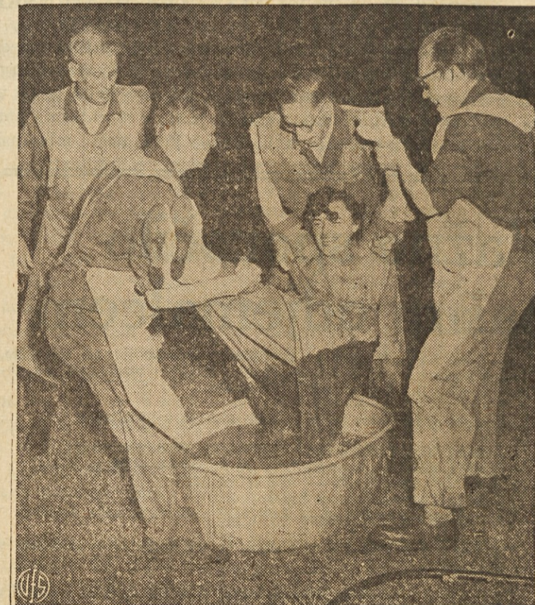
KOT V STARIH ČASIH — Mlado tiskarsko pomočnico so v smislu stare navade namočili v ledeno mrzli vodi, predno so jo sprejeli med se. Ta običaj izvira od začetka novega veka. Slika je posneta v Zahodnem Berlinu.

GLAVNI URAD 351-353 No. Chicago St. Joliet, Ill.