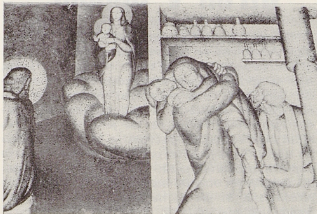
Tone Kralj: Freska v župni cerkvi v Avberju

Na narodnostnem in političnem področju pa so to malodušje ob slovenski usodi še bolj po-