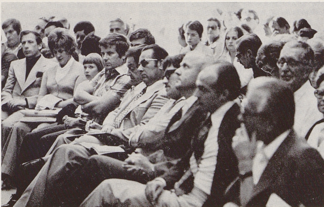
Odlični gostje v Dragi

Ko se je nekoliko umirila, se je spomnila, da še ni zaprla torbice. Prijela je za zadrgo, a jo je takoj spet izoustila. Mrzlično je segla v torbico. Zastonj! Otipala je samo robec in rdečilo. Kje je denarnica? Vroč val ji je obllil telo, obraz ji je zažarel, kot da bi se ji vneli lasje.