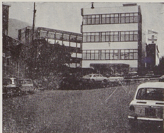
Znanstveni licej »Fr. Prešeren« in trgovski zavod »Žiga Zois«

Veliko je že bilo napisanega in marsikdo si lasti monopol in zasluge za oživitev in ustanovitev slovenskih šol, ki jih je uničilo fašistično nasilje. Po nasilni zadušitvi slovenskega šolstva na Primorskem so številni rodoljubi skušali šolo nadomestiti z zasebnimi tečaji, z razpošiljanjem knjig, duhovniki pa so si v kaplanu Čedermacu postavili trajen in trden spomenik zvestobe svojemu narodu. Med vojno, ko smo vsi, bodisi doma, po taboriščih, po gozdovih in ječah pričakovali boljše in pravičnejše čase, je bila slovenska beseda preganjana. Vsi pa smo se oklepali vsakega svetlega in toplega žarka, ki je obetal svobodo. Na Primorskem slovenskih šol ni bilo več že vrsto let. Na Štajerskem in Gorenjskem jih je okupator čez noč uničil. Po padcu fašizma se je po 8. septembru 1943 nemški okupator znesel tudi nad Primorsko. Črno sraico je zamenjal trdo okovani pruski škorenj. Isti okupator, ki je uničil slovenske šole na Štajerskem in Gorenjskem, jih je dovolil na Primorskem. Slovenci so se znašli v slepi ulici: ponudbo sprejeti ali zavrniti. Ali naj slovenski otrok še naprej obiskuje italijansko šolo, ker druge ni bilo?