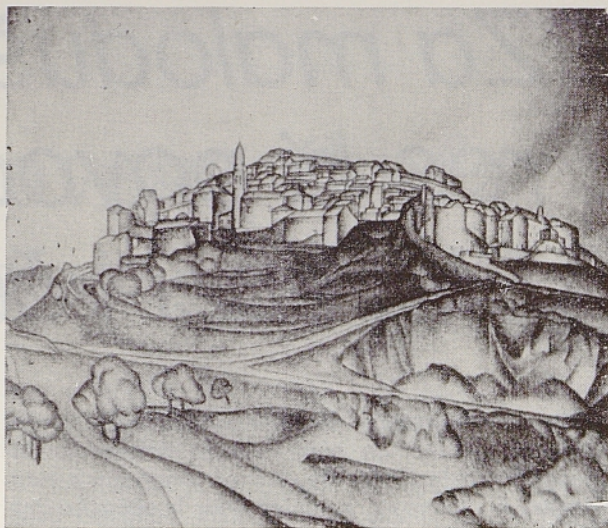
Tone Kralj: Štanjel (olja)