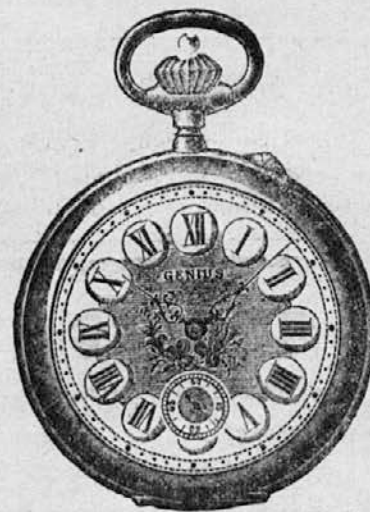
Genius: G 37 1 52 9