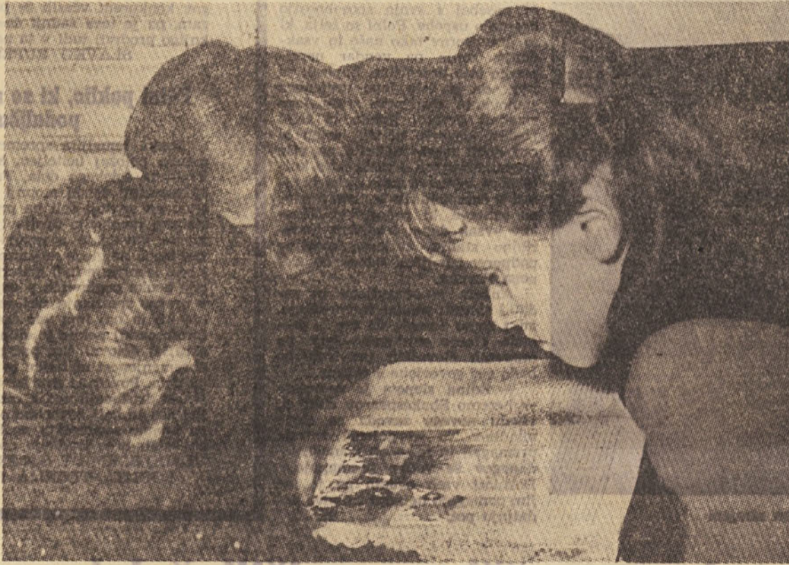
Sklonjene nad knjigo