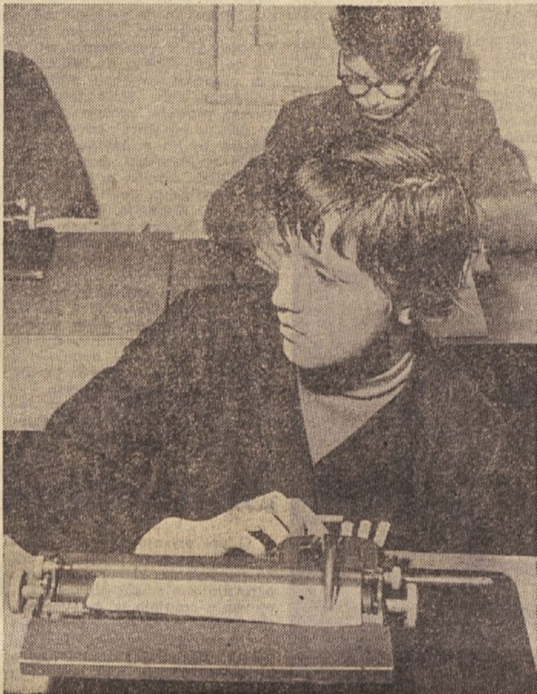
Slepi za pisalnim strojem

— Edina slepota je neznanje — beremo Shakespearov citat ob vzhodu novega zavoda za slepo mladino. To so gojenci zavoda premagali in jo — ob pomoči pedagogov — vedno premagujejo. Dolžnost vseh drugih pa je, da jim pomagajo ugledati njihovo nadaljnjo pot. M. K.