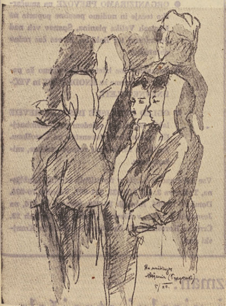
Ena izmed številnih ilustracij avtorja knjige »Odločitev«. Na partizanskem mitingu v Hašanih (Podgrmeč)