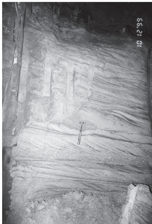
Slika 1: Navzkrižna plastovitost, stacionaža 55+270 v galeriji levo

Na stiku med spodaj ležečo glino in zgornjo prodno peščeno plastjo, ali v prodno peščeni plasti, smo pogostokrat opazovali limonitne oziroma manganske skorje, ki so verjetno nastale zaradi prekinitve sedimentacije.