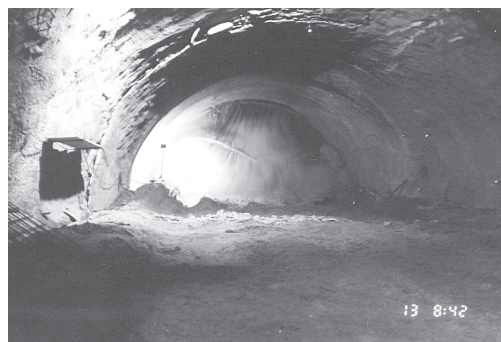
Slika 3: Zrušek na st. 55+329 v fazi sipanja največje količine materiala 13.2.2000 ob 8uri 42 minut. Lepo vidna razpoka v primarni oblogi (levo).

Med izkopom za kaloto jug je v jutranji izmeni 13.2.2000 na st. 55+329 prišlo do močnega povečanja konvergenč, ki je kulminiralo z rušenjem in zapolnitvijo čela kalote z zemljino in lijakom porušitve do površine. Lijak neposredne porušitve je znašal na površini približno 6x9 metrov. Hkrati z lijakom so bile lepo opazne tudi razpoke na površini, ki segajo do približne stac. 55+310. V smeri napredovanja ne sledimo stopenj, ki bi kazale na širjenje rušenja pred