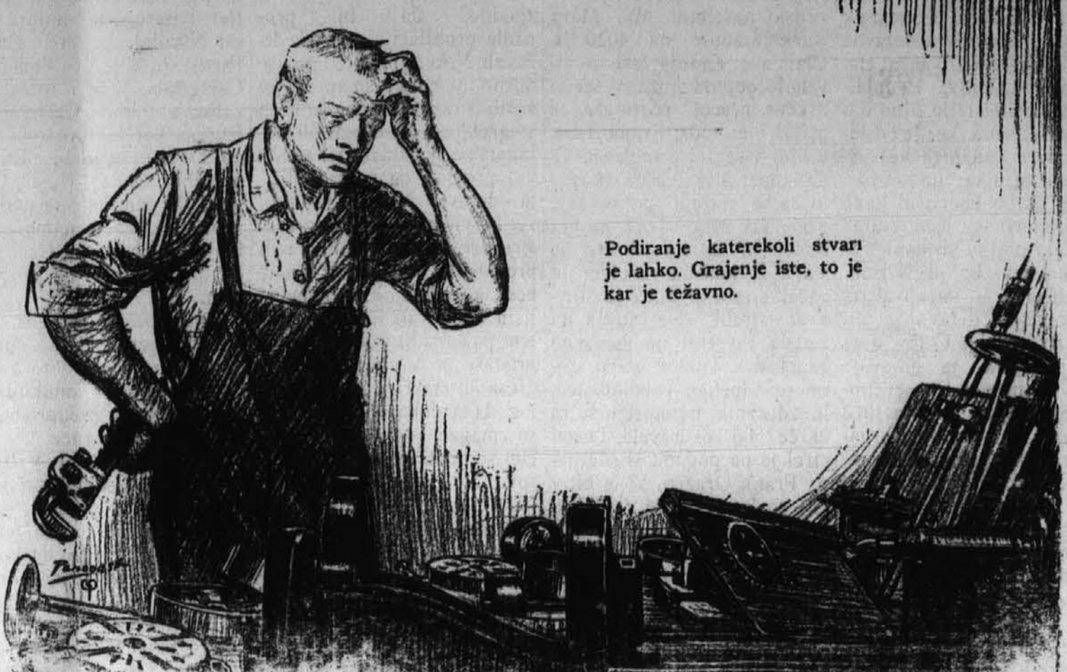
Podiranje katerekoli stvari je lahko. Grajenje iste, to je kar je težavno.

Opomba: Kadar se kateri iz med teh uradnikov preseleli in menja svoje bivališče naj to nemudoma naznani tajniku njih društva. Tajnik, ko dobi sporočilo od uradnika naj on potem uradnim potom naznani na vrh. urad, da se naslov spremeni.