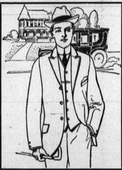
Naročite si sedaj novo OBLEKO ZA SPOMLAD

Kadarkoli pošiljate denar kamorkoli, vselej zahtevajte American Express Company rezit za to. To je zavarovalnina proti zgubi.