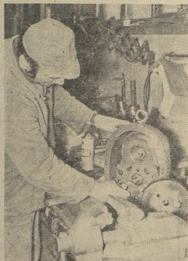
Ključavničar v TOZD V