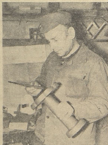
Modelni mizar v TOZD V