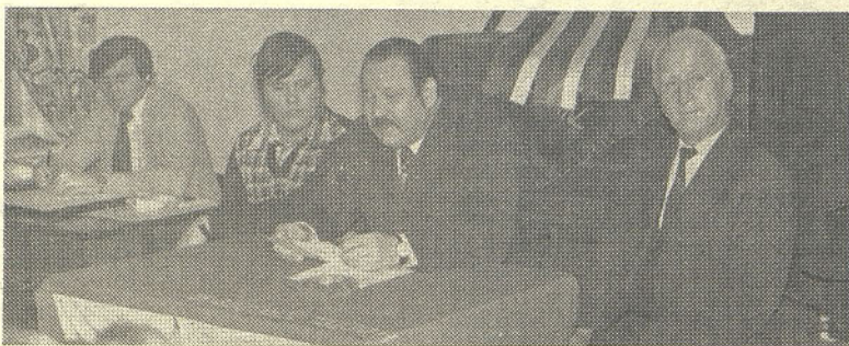
Delovno predsedstvo na letnem občnem zboru industrijskega gasilskega društva Steklarne Hrastnik

Dne 15. januarja 1977 je imelo gasilsko društvo Steklarne svoj redni letni občni zbor. Po statutu se občni zbor vrši vsako drugo leto (možnost je dana tudi na 4 leta), med občinama zboroma se vrši letna konferenca. V letošnjem letu je bil občni zbor, na katerem so bile volitve v organe društva. Letos do večjih kadrovskih sprememb v društvu ni prišlo. Člani društva so bili zadovoljni z delom UO v pretekli mandatni dobi in je bil izvoljen naslednji upravni