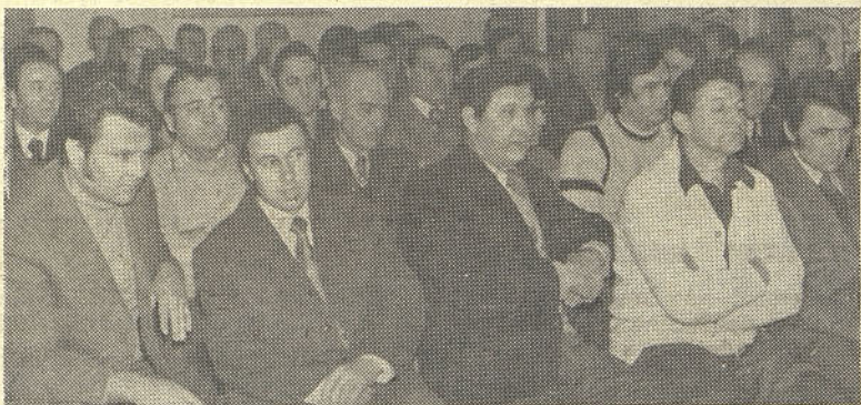
Člani in gostje na občnem zboru