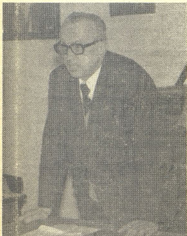
Predsednik Industrijskega gasilskega društva Steklarne Hrastnik otvarja in pozdravlja občni zbor