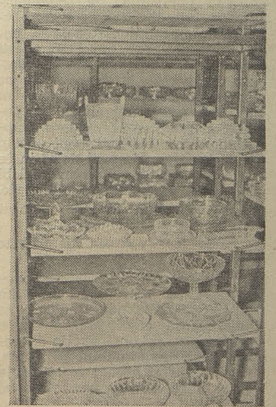
Vzorčna soba izdelkov Steklarne Hrastnik

Se posebej morajo ti programi bazirati na finalizaciji naših izdelkov in na ideji, ki ne bo več kopija, ampak bo nastala v Steklar-ni Hrastnik ter bo tako imela tudi večjo tržno vrednost. Seveda pa moramo tako za nov artikel primarno ugotoviti, če ga tržišče sploh potrebuje in ne obratno, da proizvodnja že steče, potem pa vidimo, da trg teh proizvodov ne potrebuje. Prav tako pa je nujno aktivirati vse spremljevalne dejavnosti ob uvedbi novega programa — od reklame, embalaže do angažiranega pristopa naše prodajne službe do takega programa v odnosu na tržišče.