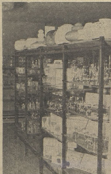
Asortiment steklenih izdelkov v izložbeni sobi

VODORAVNO: Džemal, rapsod, samba, Razija, Aleksa, omara, ogorek, Jena, slikar, zapoved, dleto, oda, G. R., cendra, risanka, Au, Becaud, entlanje, Amer, Izanka, Italija, Nara, mina, dota, Egon, žanr, Onek, Ake, Aceva, era, Nagib, rvar, Rom, Rim, rtina, lek, sedlarji, sij, Kartum, omikron, Venera, Oona, kanasta, Krakar, frak.