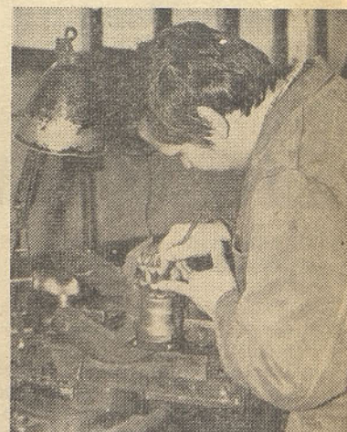
Cizeler v TOZD IV

NAD 100 LET DELOVNIH TRADICIJ IN IZKUŠENJ