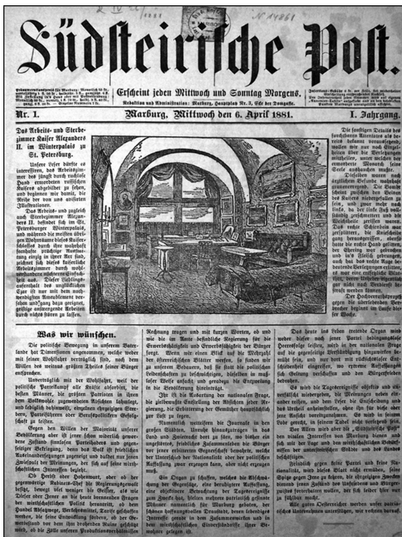
Prva številka nemškega časnika, ki se je zavzemal za interese Slovencev (Südsteirische Post, št. 1, 6. 4. 1881).

širšem spodnještajerskem časnikarskem področju ter z njim povezano večje število bralcev. Drugi razlog je bil tesno povezan s prvim, zlasti pa še s financami. Ilustracije, ki so višale stroške vsake številke lista, so se morale umakniti veliko donosnejšim oglasom. Objavo le-teh so naročniki seveda morali plačati, list pa je s tem dobil finančno podlago za nadaljnje izhajanje. 54