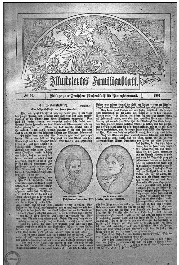
Illustriertes Familienblatt (št. 50, 1901).

Vsebinska zasnova ilustrirane družinske priloge Illustriertes Familienblatt je bila precej podobna prilogi časnika Pettauer Zeitung . Uvodoma je pri-