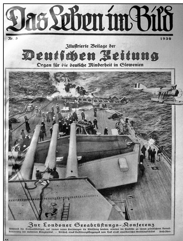
Das Leben im Bild. Illustrierte Beilage der Deutschen Zeitung, Organ für die deutsche Minderheit in Slowenien (št. 3, 1930).

Ko leta 1876 ponovno izide Cillier Zeitung 25 – tokrat izpod preše celjskega tiskarja Janeza Rakuscha – uredništvo kljub nenehnemu nihanju naklade 26 ne poseže po triku izdajanja ilustrirane priloge, ki bi privabila več bralcev. Šele leta 1929, ko se 6. januarja po uvedbi diktature kralja Aleksandra politične razmere močno zaostrijo in postane položaj Nemcev v novi državi Kraljevini Jugoslaviji sila neugoden, začne izhajati prva literarna priloga tega osrednjega celjskega lista, energičnega zagovornika nemških interesov. A prva številka priloge ni bila priložena Cillier Zeitung , temveč časniku Deutsche Zeitung . 27 Spre-