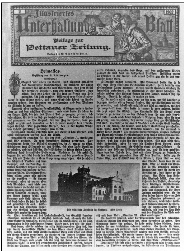
Illustriertes Unterhaltungsblatt (št. 2, 12. 1. 1902), zabavna priloga Pettauer Zeitung .