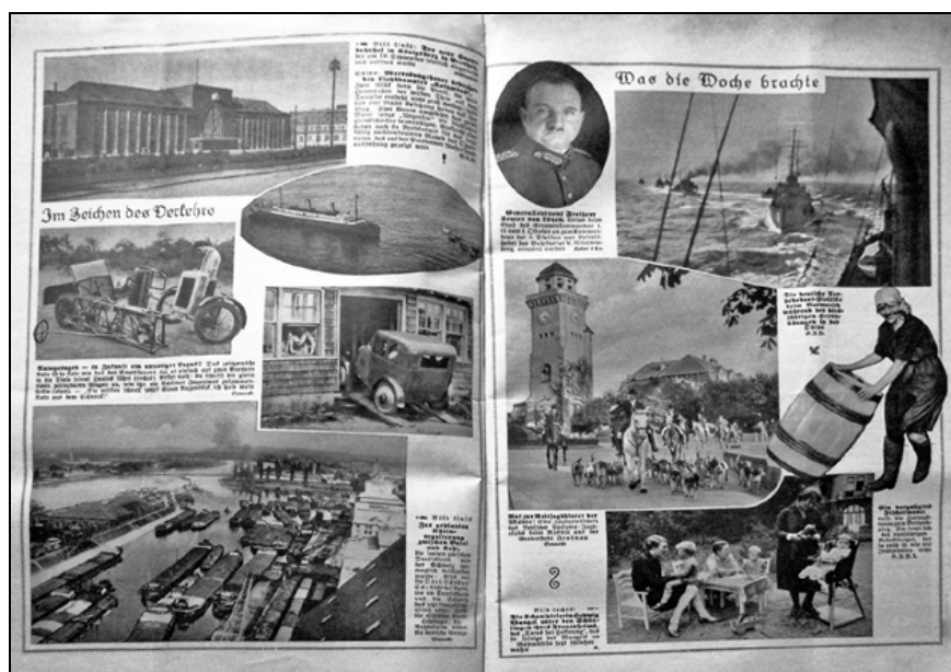
Das Leben im Bild (št. 39, 1929, str. 2-3). 28

membo naslova je uradno zahtevalo državno tožilstvo iz Celja, saj poimenovanje "Cillier" ni bilo v skladu z novim zakonom. 29 Tako se je uredništvo Cillier Zeitung odločilo za ime Deutsche Zeitung , ki naj bi najprimerneje izražalo to, kar je list v resnici tudi bil, torej Organ für die deutsche Minderheit in Slowenien , nemški obveščevalni organ, namenjen nemški manjšini na Slovenskem. 30